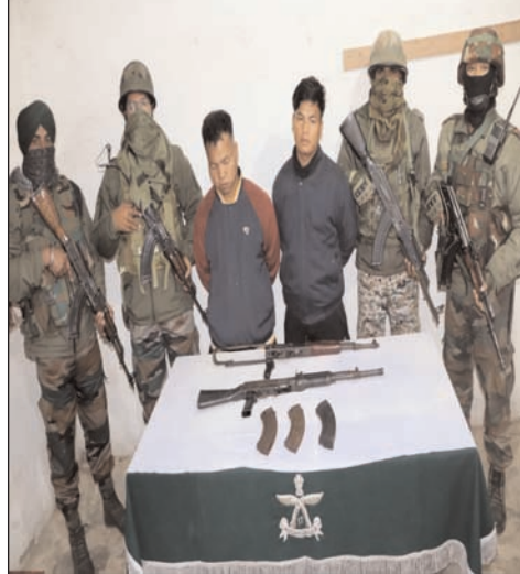
खान्डा-बान्डा दो लाहा सेक् जाँच लागित् ते टोटाकिया रेन पुलिसको जिमावात्कोआ।

स्वामी, प्रकाशक, मुद्रक एवं संपादक अशोक कुमार द्वारा भास्कर प्रिंटिंग प्रेस, धनबाद गोविंदपुर मेन रोड अशोक नगर, केजी आश्रम, गोसाईंडीह धनबाद झारखंड से मुद्रित तथा संताल एक्सप्रेस कार्यालय दंगालपाड़ा, हिजला रोड, दुमका (झारखंड) से प्रकाशित, RNI NO. JHABIL/2018/76383, सलाहकार संपादक चंदन मिश्र, प्रबंध संपादक सिद्धार्थ कुमार, स्थानीय संपादक चुण्डा सोरेन 'सिपाही' फोन न. 7367009287, 9771486686