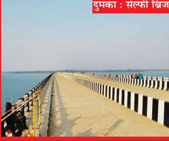
दुमका : सेल्फी ब्रिज