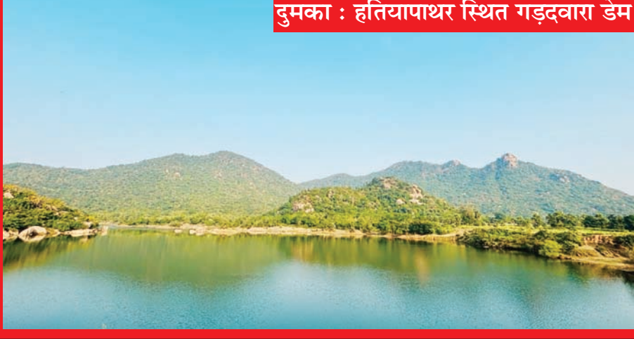
दुमका : हतियापाथर स्थित गड़दवारा डेम