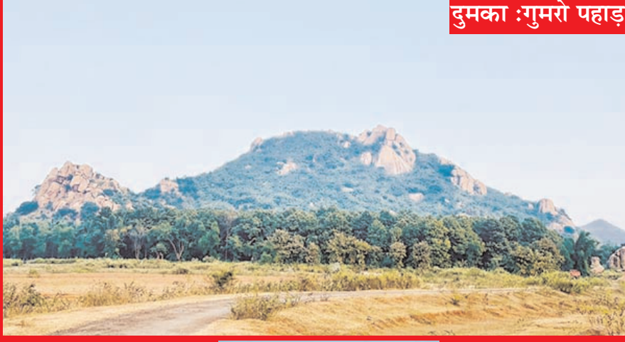
दुमका : गुमरो पहाड़