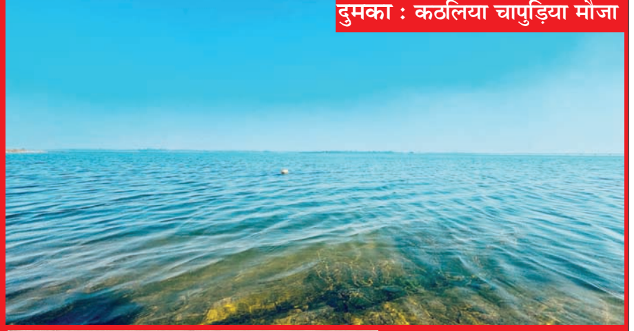
दुमका : कठलिया चापुड़िया मौजा