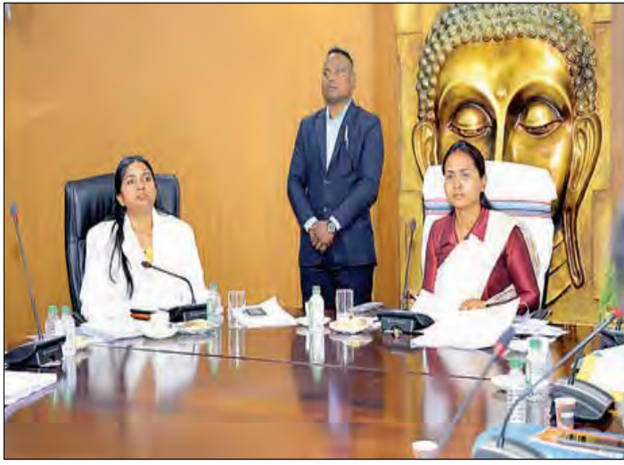
हर हाथ में हासिल करने को कहा गया है। मुख्यमंत्री पशुधन योजना के जिलावार रिपोर्ट से विभागीय मंत्रियों के समक्ष रखा गया।

पशुपालन विभाग की समीक्षा बैठक में मुख्यमंत्री पशुधन योजना प्रगति रिपोर्ट से नाराज दिखी मंत्री रांची। कृषि, पशुपालन एवं सहकारिता मंत्री शिल्पी नेहा तिवारी ने मुख्यमंत्री पशुधन योजना की सुस्तों पर नाराजगी जाहिर की है। रांची के हेसाग स्थित पशुपालन भवन में आयोजित समीक्षा बैठक के दौरान विभागीय अधिकारियों के 20 फरवरी तक लक्ष्य का 80 प्रतिशत पशु वितरण का निर्देश दिया है। वे आंकड़ा जिला स्तर पर हासिल करने को कहा गया है। मुख्यमंत्री पशुधन योजना के जिलावार रिपोर्ट से विभागीय मंत्रियों के समक्ष रखा गया। अंसुतु दिखी। मंत्री शिल्पी नेहा तिवारी ने कहा है कि समय पर लाघुकों का चयन और सूची तैयार नहीं होने से विभाग अपने तय लक्ष्य को हासिल नहीं कर पा रहा है। इसके लिए जरूरी है कि समय सीमा के अंदर योग्य लाघुकों का चयन प्रक्रिया पूर्ण कर ली जाए। मुख्यमंत्री पशुधन योजना में गुटियों को समय रहते दूर करने पर भी चर्चा की गई है। इसके लिए राज्यादेश में सुधार किया जाएगा, ताकि लाघुकों को पशुधन योजना का लाभ देने में कोई अड़चन पैदा न हो। इसके साथ ही पशुपालन विभाग के द्वारा संचालित फार्मर्स अग्ले 5 साल के विजन डॉक्यूमेंट्स को मंत्री शिल्पी नेहा तिवारी के समक्ष रखा गया।