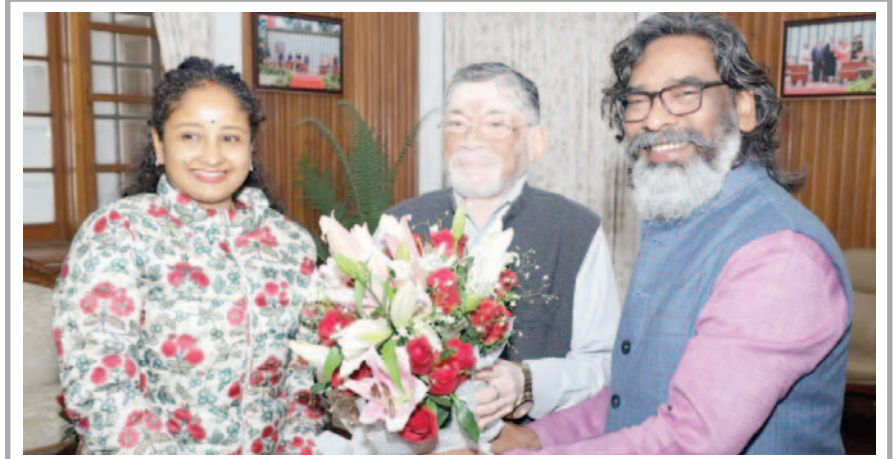
राज्यपाल संतोष कुमार गंगवार से राजभवन में मुख्यमंत्री हेमन्त सोरेन एवं विधायक कल्पना सोरेन ने मुलाकात कर उन्हें नववर्ष 2025 की हार्दिक बधाई एवं शुभकामनाएं दी।

मुख्यमंत्री ने कहा कि आदिवासी समुदाय का हमेशा से प्रकृति के साथ गहरा जुड़ाव रहा है। जल-जंगल और जमीन की रक्षा के लिए वे शुरू से संघर्ष करते रहे हैं। आज अगर प्रकृति के प्रति लगाव को लेकर आदिवासी समुदाय के पद चिन्हों पर चलते हुए उसका अनुसरण कर रहे होते तो प्राकृतिक आपदाओं तथा पर्यावरण संरक्षण की खातिर इतनी जटिल जेड नहीं करनी पड़ती।