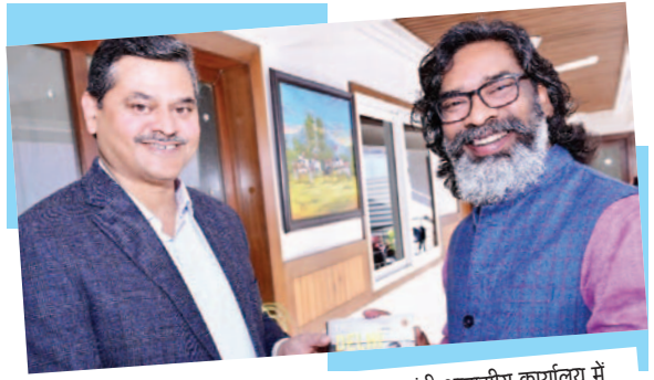
मुख्यमंत्री हेमन्त सोरेन से कांके रोड रांची स्थित मुख्यमंत्री आवासीय कार्यालय में अपर मुख्य सचिव अश्विनाथ कुमार ने मुलाकात कर उन्हें नववर्ष 2025 की हार्दिक बधाई एवं शुभकामनाएं दी। मौके पर मुख्यमंत्री ने भी उन्हें अपनी ओर से नूतन वर्ष की हार्दिक बधाई एवं मंगलकामनाएं दी।

आकर में प्रातः 11:00 बजे तक अपना रजिस्ट्रेशन कर लेंगे। महोत्सव परिसर में चलत एटीएम की व्यवस्था की गई है। आज महोत्सव में खादी एवं ग्रामोद्योग उत्पादों के साथ-साथ अन्य सामग्रियों की बिक्री लगभग दो करोड़ की रही है।