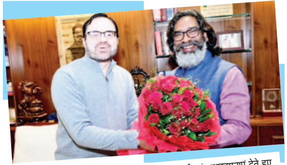
मुख्यमंत्री हेमन्त सोरेन को नववर्ष 2025 की हार्दिक बधाई एवं शुभकामनाएं देते हुए झारखंड निर्वाचन आयोग के अध्यक्ष डीके0 तिवारी।