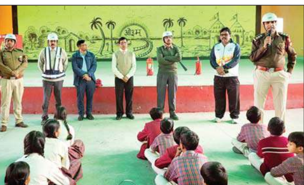
बच्चों को आग से बचाव के उपाय बताते अधिकारी।

बीजपुर। डीएवी पब्लिक स्कूल एनटीपीसी रिहंदनगर में सोमवार को आग लगने की स्थिति में बचाव के उद्देश्य से माॅक ड्रिल का अभ्यास किया गया। आग लगने की सूचना अग्निशमन विभाग, इलेक्ट्रिकल विभाग व थानाध्यक्ष आदि को दिया गया। सूचना मिलते ही सीआईएसएफ की अग्निशमन विभाग के कर्मी पहुंच गये। वहीं ध्वंस्तंरि चिकित्सालय से एंबुलेंस भी पहुंच गयी। सभी बच्चे सुरक्षित बाहर आ गए।