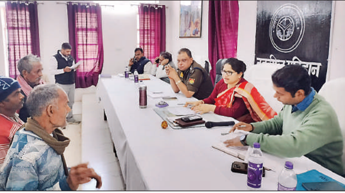
फरियादियों की समस्या सुनते डीएम व एसपी

कार्यावाही की जाएगी। जिलाधिकारी ने कहा कि आई0जी0 एच0एएस0 व मुख्यमंत्री हेल्पलाइन पर प्राप्त हो रही शिकायतों का निस्तारण अधिकारी कार्यालय से ही न कर-के बल्कि मौके पर स्थलिय निरीक्षण करते हुए फोटोग्राफ के साथ आख्या पोर्टल पर अपलोड करें। इस अवसर पर