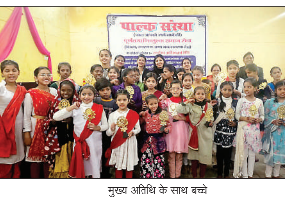
मुख्य अतिथि के साथ बच्चे

मीरजापुर। पालक संस्था द्वारा विंटर विकेशन में आर्थिक रूप से कमजोर बालिकाओं को निःशुल्क कथक नृत्य का प्रशिक्षण लालडिगगी स्थित संस्था के शाखा पर दिया गया जिसमें 40 बालिकाओं ने भाग लिया। कथक नृत्य के समापन समारोह कार्यक्रम में मुख्य