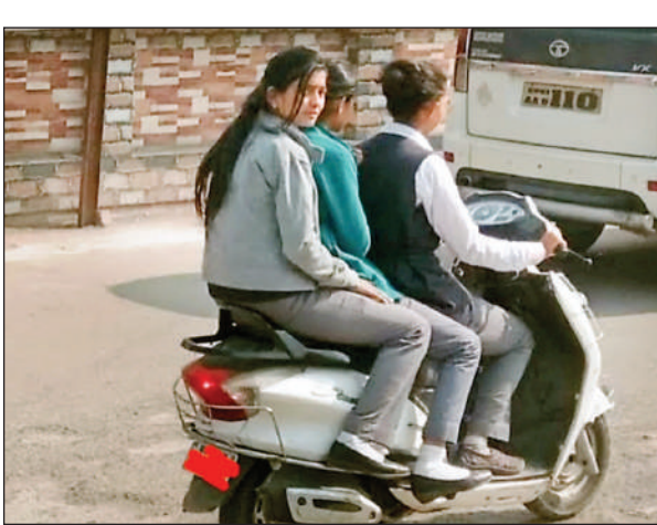
पुलिस अधीक्षक कार्यालय से गुजरती हुई स्कूटी पर सवार तीन युवतियां।