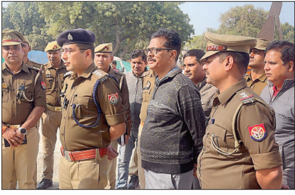
निरीक्षण करते पुलिस अधिकारी

पर्व मां विन्ध्यवासिनी देवी के सुगम दर्शन-पूजन करने सहित चुरस दुर्स्त सुरक्षा व्यवस्था बनाए रखने हेतु पुलिस कटिबद्ध है। उक्त सघन चेंकिंग अभियान के दौरान थानाध्यक्ष