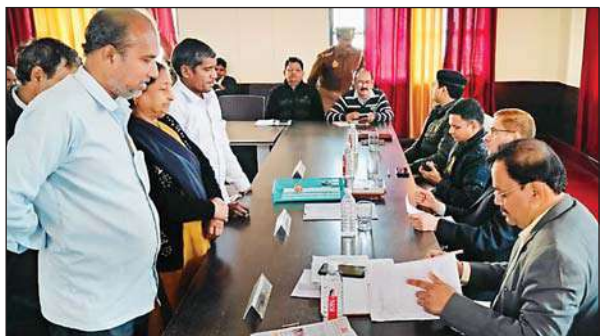
घोरावल तहसील में पीड़ितों की फरियाद सुनते डीएम व एसपी।