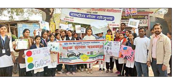
धानापुर में जागरूकता के लिए रैली निकालते स्वयंसेवक।

सेप्टी माह धानापुर में स्वयंसेवकों ने आमजन को किया जागरूक धानापुर। कस्बा स्थित शहीद हीरा सिंह राजकीय स्नातकोत्तर महाविद्यालय के प्रतियोगिता में प्रतिभाग करें। साथ ही साथ यह भी अवगत कराना है कि 27 जनवरी को एथलेटिक्स, कबड्डी, वॉलीबाल 28 जनवरी को कुश्ती, भारोत्तोलन, जूडो, बैडमिंटन व फुटबॉल के विजेता खिलाड़ी प्रतिभाग करेंगे। प्रतियोगिता आयु सीमा के अनुरूप कराया जायेगी। प्रतियोगिता में विजेता व उपविजेता खिलाड़ियों को पुरस्कार व प्रमाण-पत्र देकर सम्मानित किया जायेगा। इस दौरान स्वयंसेवकों ने लोगों को