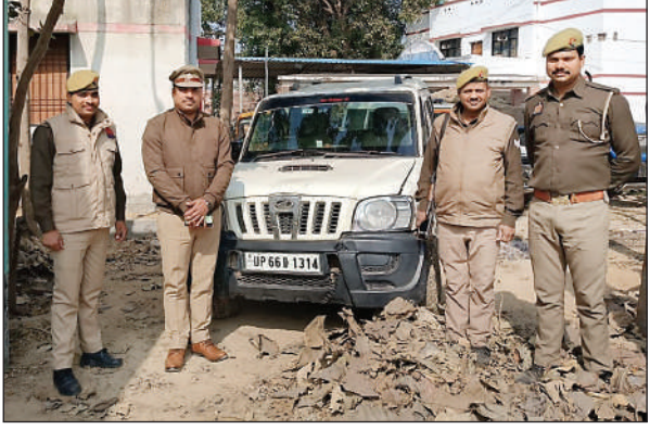
बरामद चोरी की स्काॅर्पियो के साथ पुलिस टीम।