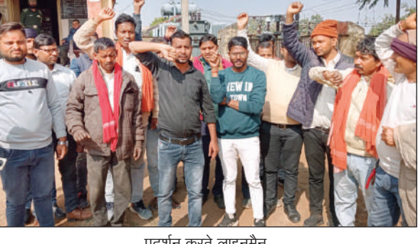
प्रदर्शन करते लाइनमैन

कार्रवाई नहीं होने पर लामबंद हुए लाइनमैन