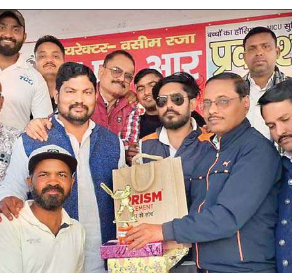
खिलाड़ी को पुरस्कृत करते मुख्य अतिथि।