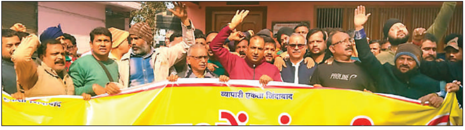
फोर लेन के समर्थन में डीडीयू नगर में जुलूस निकालते व्यापारी।