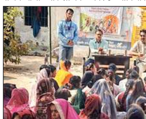
ग्रामीणों को प्रशिक्षण देते ट्रेनर।

ऑनलाइन लेन-देन, सरकारी पोर्टल के माध्यम से ई सर्विस सुविधाओं का उपयोग और डिजिटल सुरक्षा जैसे महत्वपूर्ण विषयों पर जानकारी दी गई। मैनेजर डिजिटल लिटरेसी ने बताया कि डिजिटल साक्षरता