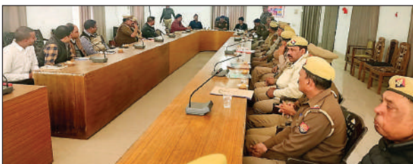
नौगढ़ थाना सभागार में अधिकारियों के साथ बैठक करते एएसपी।