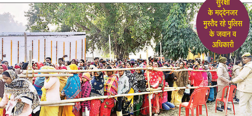
सुरक्षा के मद्देनजर मुस्तैद रहे पुलिस के जवान व अधिकारी