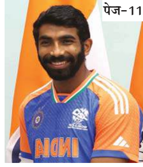
इंग्लैंड के खिलाफ पहले एक.....