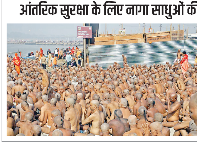
आंतरिक सुरक्षा के लिए नागा साधुओं की अपनी कोतवाली होती है नागा अखाड़े के कोतवाल इस तरह की देते हैं सजा