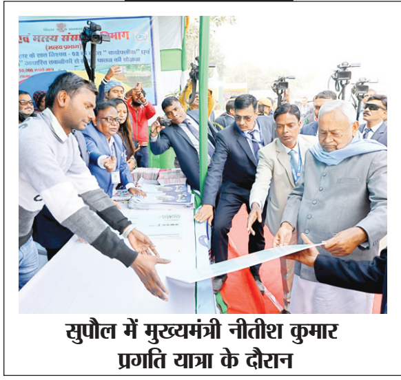
सुपौल में मुख्यमंत्री नीतीश कुमार प्रगति यात्रा के दौरान

विधानसभा चुनाव में 12 फरवरी 2022 के दौरान मुख्यमंत्री पुष्कर सिंह धामी ने यूसीसी की घोषणा की थी। धामी मंत्रिमंडल की पहली बैठक में यूसीसी लाने के लिए फैसला लिया गया। मई 2022 में सुप्रीम कोर्ट की सेवानिवृत्त न्यायाधीश रंजना प्रकाश देसाई की अध्यक्षता में विशेषज्ञ समिति बनी। समिति ने 20 लाख सुझाव ऑफलाइन और ऑनलाइन प्राप्त किए। 2.50 लाख लोगों से समिति ने सीधा संवाद किया। 02 फरवरी 2024 को विशेषज्ञ समिति ने ड्राफ्ट रिपोर्ट मुख्यमंत्री को सौंपी। सात फरवरी को विधेयक विधानसभा से पारित हुआ। राजभवन ने विधेयक को मंजूरी के लिए राष्ट्रपति को भेजा। राष्ट्रपति ने 11 मार्च यूसीसी विधेयक को अपनी मंजूरी दी। यूसीसी कानून के नियम बनाने के लिए एक समिति का गठन किया गया।