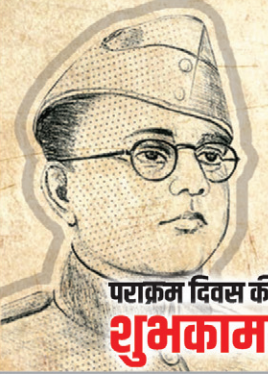
पराक्रम दिवस की शुभकामनाएं