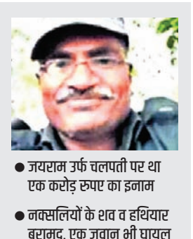
● जयराम उर्फ चलपती पर था एक करोड़ रुपए का इनाम

छत्तीसगढ़ के गरियाबंद जिले के छत्तीसगढ़-ओडिशा बॉर्डर पर स्थित भालू डिग्री के जंगल में सुरक्षा बलों और नक्सलियों के बीच हुई मुठभेड़ में बड़ी कामयाबी मिली है। इस मुठभेड़ में एक करोड़ के इनामी नक्सली जयराम उर्फ चलपती सहित 16 के मारे जाने की रायपुर संभाग के आईजी ने पुष्टि की है। इन सभी 16 नक्सलियों के शव और हथियार बरामद किए जा चुके हैं। इस मुठभेड़ में अब तक 20 से अधिक नक्सलियों के मारे जाने की खबर है। इसमें एक जवान भी घायल हुआ है, जिसे एयरलिफ्ट कर रायपुर लाया गया है। ज्ञात हो कि चलपति आंध्र प्रदेश के चित्तूर को जिले के मदनपल्ले का रहने वाला था। चलपति पर आंध्र प्रदेश सरकार ने एक करोड़ इनाम घोषित कर रखा था। कई जन्मतिथिनिधियों की हत्या में उसकी महत्वपूर्ण भूमिका रही थी। रविवार की रात से शुरू हुई मुठभेड़ में मंगलवार सुबह तक 16 नक्सलियों को मारे जाने की पुष्टि