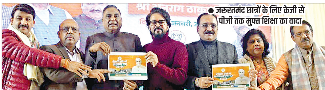
जरूरतमंद छात्रों के लिए केजी से पीजी तक मुफ्त शिक्षा का वादा

भारतीय जनता पार्टी ने अपने वादे के मुताबिक दिल्ली विधानसभा चुनाव के लिए आज संकल्प पत्र भाग-2 जारी किया। इसमें जरूरतमंद छात्रों को केजी से पीजी तक की शिक्षा मुफ्त देने का वादा किया गया है। साथ ही युवाओं को प्रतियोगी परीक्षाओं की तैयारी के लिए 15 हजार रुपये की वित्तीय सहायता देने की भी घोषणा की गयी है। भाजपा के वरिष्ठ नेता एवं पूर्व केंद्रीय मंत्री अनुराग ठाकुर ने यह संकल्प पत्र जारी किया। अनुराग ठाकुर ने पार्टी के प्रदेश मुख्यालय में आयोजित कार्यक्रम में कहा कि इस संकल्प पत्र से दिल्ली का विकास होगा। उन्होंने कहा कि पार्टी की सरकार बनने पर दिल्ली के युवाओं को प्रतियोगी परीक्षाओं