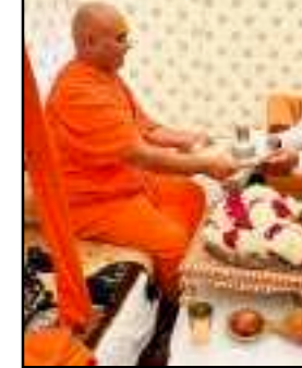
का फरसा और कई तरह के भेंट आदि शंकराचार्य की चरण पादुका की पूजा अर्चना के बाद शंकराचार्य को भेंट की। उप मुख्यमंत्री ने कहा कि मैंने कोखनऊ में उतर प्रदेश के मुख्यमंत्री योगी आदित्यनाथ से मुलाकात

की एवं भव्य तथा दिव्य महाकुम्भ के आयोजन के लिए शुभकामनाएं दीं। उन्हें परशुराम