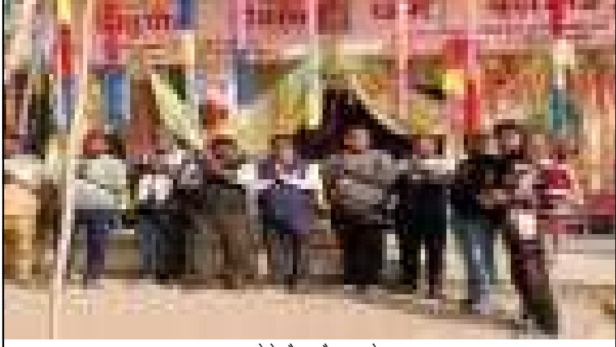
भण्डारे के दौरान मौजूद आयोजकगण

परियावां, प्रतापगढ़। विकास खंड कालाकांकर स्थित जनवामऊ में ग्रामवासियों व मंदिर पूजा कमेटेी के पदाधिकारियों द्वारा मंगलवार को मां भवानी धाम बूढ़ी माई जनवामऊ में बुधवार को अखण्ड रामायण के समापन