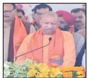
महाकुंभ में बुधवार को आयोजित कैबिनेट बैठक में हुए फैसलों को बारे में

योगी कैबिनेट का फैसला हुआ है कि बागपत, हाथरस और कासगंज जिलों में मेडिकल कालेजों का निर्माण होगा। प्रयागराज, वाराणसी और आगरा नगर निगम अपने बांड जारी कर सकेंगे, जिससे निगमों की वित्तीय हालत में सुधार हो सकेगा। साथ ही मीरजापुर से प्रयागराज तक एक एक्सप्रेस-वे बनाया