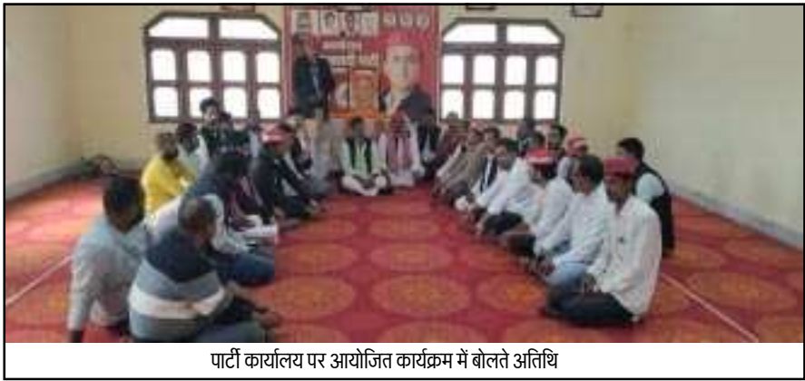
पार्टी कार्यालय पर आयोजित कार्यक्रम में बोलते अतिथि

प्रतापगढ़। समाजवादी पार्टी कार्यालय मीराभवन पर प्रख्यात समाजवादी चिन्तक एवं दार्शनिक छोटे लोहिया जनेश्वर मिश्रा की पुण्यतिथि पर