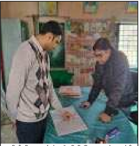
परिषदीय विद्यालय अरई सुमेरपुर में उपस्थित पंजिका का अवलोकन करते डीएम

इसी के साथ प्राथमिक विद्यालय अरई सुमेरपुर के निरीक्षण के दौरान