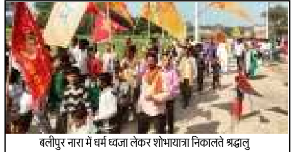
बलीपुर नारा में धर्म ध्वजा लेकर शोभायात्रा निकालते श्रद्धालु

स्वतंत्र चेतना कौशांबी। श्रीधाम अयोध्या में श्रीराम मंदिर प्राण प्रतिष्ठा के एक वर्ष पूरे होने पर जनपद में जगह-जगह हर्षोल्लास का माहौल रहा। जिले के विभिन्न क्षेत्रों व कस्बों में भगवान श्रीराम की शोभायात्रा निकाली गई। इस दौरान श्रीराम के जयकारों से क्षेत्र गुंजायमान रहा।