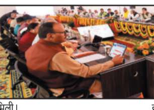
एक्सप्रेस-वे का विधेयक जाल योगी आदित्यनाथ ने कहा कि जिस महाकुंभ को ध्यान में रखकर प्रयागराज के साथ-साथ इस पूरे क्षेत्र का सांस्कृतिक

विश्वनाथ धाम बनने के बाद काशी वैशिक पटल पर ख रहा है। उन्होंने बताया कि वाराणसी-विंध्य को एक डेवलपमेंट रीजन बनाने की कार्यवाही को भी आगे बढ़ाया जायेगा। इससे यहां के न केवल पर्यटन की दृष्टि से यहां पर रोजगार के सृजन में बड़ी भूमिका का निर्वहन करेगा। चित्रकूट और प्रयागराज को भी गंगा एक्सप्रेस के साथ जोड़ने की कार्यवाही हो रही है। प्रयागराज में यमुना नदी पर सिनेचर ब्रिज के समानांतर एक नए पुल के निर्माण प्रस्ताव को स्वीकृति