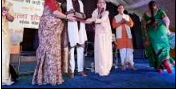
जो भारत की संस्कृति ताकत का प्रतीक है। शेखावत ने बुधवार को इलाहाबाद

केन्द्रीय मंत्री ने कहा कि जब प्रयागराज की ओर पूरे विश्व की दृष्टि है और 144 साल के अंतराल के बाद में दिव्य महाकुम्भ प्रयागराज में संपन्न हो रहा है। उस समय में इस इलाहाबाद जैसे ऐतिहासिक संग्रहालय ने कुम्भ की आध्यात्मिक मान्यता से जुड़े प्रसंगों को लेकर भागवत नाम से एक प्रदर्शनी का आयोजन किया गया है। इस प्रदर्शनी के माध्यम से एक तरफ कुम्भ और कुम्भ से जुड़े हुए प्रसंगों में भगवान श्रीराम और श्रीकृष्ण से जुड़ी हुई कथा से जुड़े चित्रों का प्रदर्शन किया। उन्होंने कहा कि भारत की आज से सैकड़ों साल पहले जो कला की समृद्धि और गहराई थी, उसको देखने और समझने का अवसर भी यहां आने वाले लोगों को मिलेगा। शेखावत ने कहा कि संस्कृति मंत्रालय ने भारत के इस महाकुम्भ की शाश्वतता को प्रदर्शित करने के लिए कलाग्राम बनाया है। उस कलाग्राम में शाश्वत नाम से एक प्रदर्शनी का आयोजन किया गया है। उन्होंने कहा कि कलाग्राम में कुम्भ के 3 हजार साल के लिखित और अलिखित इतिहास को दिखाया गया है। साथ ही, विविधताओं से भरे देश को कैसे एकता के सूत्र में बांधने का काम किया गया है, उसको भी प्रदर्शित किया गया है।