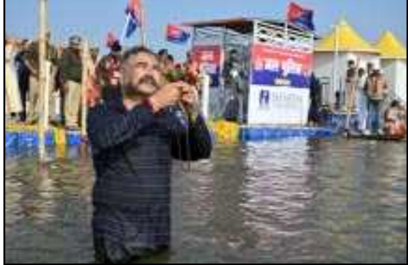
व्यवस्थाओं की प्रशंसा की। श्रद्धालु ने कहा कि यहां की व्यवस्थाएं अनुकरणीय हैं और धार्मिक आगंतुकों के प्रबंधन का बेहतर इंतजाम किया गया है।

विदेशी श्रद्धालु ने की सराहना स्नान के दौरान डीजीपी से दक्षिण अफ्रीका के एक श्रद्धालु ने महाकुम्भ की