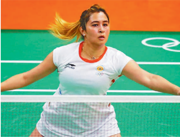
कभी अविश्वसनीय है कि ऐसे शिक्षित और बड़े संगठनों के उच्चतम पदों पर बैठे लोग मेंटली हेल्थ और मेंटली आराम को सीरियस नहीं ले रहे हैं और इस तरह के महिला

नई दिल्ली, एजेंसी। लार्सन एंड टुब्रो (रूड़) के चेयरमैन एसएन सुब्रमण्यम ने अपने कर्मचारियों को सप्ताह में 90 घंटे काम करने का सुझाव दिया था। उन्होंने साथ ही कहा था कि आप घर पर 'पत्नी को कब तक निहारोगे'। उनके इस बयान पर विवाद खड़ा हो गया है। बॉलीवुड एक्ट्रेस दीपिका पादुकोण ने भी इस मामले पर सुब्रमण्यम को आड़े हाथों लिया। जबकि मशहूर बैडमिंटन खिलाड़ी ज्वाला गुप्ता ने भी सुब्रमण्यम के इस बयान पर उन्हें जमकर खरी खोटी सुनाई है और उनके बयान को निराशाजनक एवं डरावना बताया है।