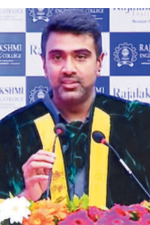
'क्या कोई हिंदी में सवाल पूछने में इंटेरेस्टेड है?' इसे लेकर छात्रों का रिएक्शन बेहद चौंकाने वाला रहा। किसी ने भी अश्विन के सवाल में

नई दिल्ली, एजेंसी। हाल ही में इंटरनेशनल क्रिकेट से संन्यास लेने वाले दिग्गज भारतीय खिलाड़ी रविचंद्रन अश्विन का विवादों से भी खूब नाता रहा है। अब संन्यास के कुछ दिनों बाद फिर से वे एक बयान के चलते विवादों में आ गए हैं। उनके हिंदी भाषा को लेकर दिए गए बयान पर देशभर में बहस छिड़ गई है। अश्विन ने कहा कि हिंदी आधिकारिक भाषा है ना कि हमारी राष्ट्रीय भाषा। अब उनके बयान को लेकर जमकर बवाल मच रहा है। अश्विन ने चेन्नई के एक कॉलेज में स्पोर्ट्स से बात करते हुए एक सवाल किया था।