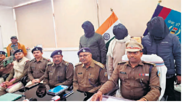
□ कस्टमर केयर का एप बनाकर लोगों से करते थे डंगी पातः नागपुरी संवाददाता