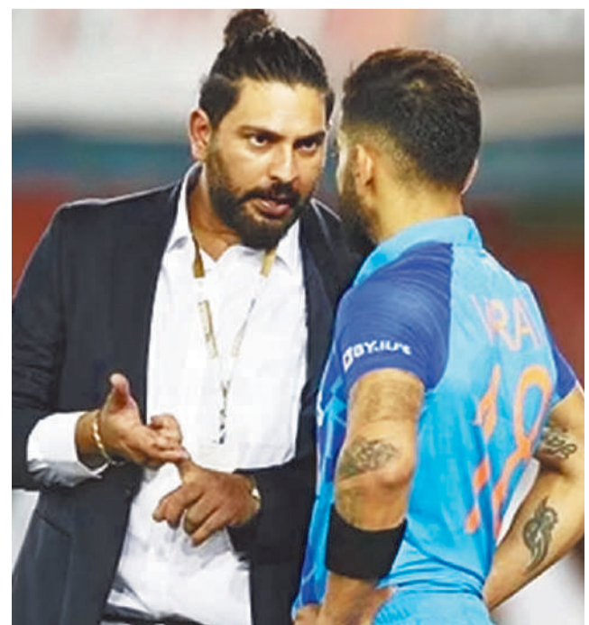
बाद में फिटनेस टेस्ट पास किया और अपनी जगह बनाई। लेकिन एक खराब टूर्नामेंट के बाद से उन्हें बाहर कर दिया गया। फिर उनसे पलटकर किसी ने कभी नहीं पूछा। बता दें युवराज सिंह कैसर को मात देकर टीम में वापसी के बाद लगातार अच्छे प्रदर्शन में असफल रहे थे। हालांकि, उन्होंने आते ही इंग्लैंड के खिलाफ वनडे में शतक जड़ दिया था। लेकिन 2017 के चैंपियंस ट्रॉफी में अपनी छाप नहीं छोड़ पाए थे। उनका बल्ला पूरे टूर्नामेंट में खामोश रहा था। इसके बाद कोहली ने कभी भी उन्हें टीम में जगह नहीं दी। 2019 के वनडे वर्ल्ड कप टीम से उन्हें बाहर रखा। युवराज ने बताया था कि धोनी साफ किया था कि मैनेजमेंट अब उनकी ओर नहीं देख रही है। इसके बाद ही उनका करियर खत्म हो