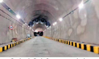
देशवासियों को मिलेगी गांदरबल से लेह तक सुकाम यात्रा की सौगात

जम्मू-कश्मीर। प्रधानमंत्री नरेंद्र मोदी सोमवार (13 जनवरी 2025) को गान्दरबल से लेह तक सुकाम यात्रा की सौगात देंगे। सुबह 10 बजे सोनमर्ग से पहले शूटकड़ी नामक स्थान पर प्रधानमंत्री जेड मोड़ टनल का उद्घाटन करेंगे। इस दौरान जम्मू-कश्मीर के उपराज्यपाल मनोज सिन्हा, मुख्यमंत्री उमर अब्दुल्ला भी मौजूद रहेंगे। पीएम मोदी के दौरे को लेकर वहां पर सुरक्षा के कड़े इंतजाम किए गए हैं। यह परियोजना क्षेत्रीय विकास और कनेक्टिविटी की दिशा में एक