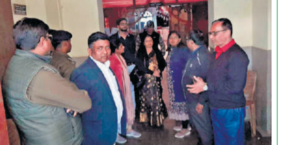
प्रातः नागपुरी प्रतिनिधि