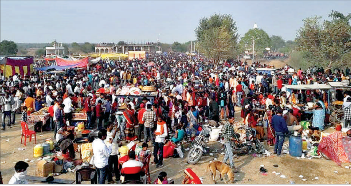
महाराज के मंदिरों का नाम शामिल है। इसके साथ ही रहस्यमयी सात मंजिली साधना सह समाधि गुफा में भी सभी लोग दर्शन एवं पूजन करते हैं। सतबहिनी भगवती मंदिर के समक्ष झरना घाटी में बड़ी संख्या में लोग सत्यनारायण भगवान की कथा सुनते हैं। यद्यपि मकर संक्रांति का पुण्य काल 15

संस्था मां सतबहिनी झरना तीर्थ एवं पर्यटन स्थल विकास समिति मेले की सफल व्यवस्था के लिए हफ्तों से जुटी हुई है। मालूम हो कि यह मेला झरना घाटी से पश्चिम की ओर सुविस्तृत मेला मैदान में लगा करता है। भारी भीड़ होने पर इस मेला से बाहर के मैदान तक दुकानें सजती हैं। जिसमें लाखों की संख्या में लोगों को खरीदारी करते देखा जाता है। इधर सूर्य के उत्तरायण होने को हिंदू धर्म में बहुत बड़े त्यौहार की मान्यता दी गई है। इस कारण लोग 14 एवं 15 जनवरी को अहले सुबह सतबहिनी पहुंचकर मनोरम झरना में स्नान करते हुए यहां के नौ मंदिरों की श्रृंखला में पूजा करते एवं दान दक्षिणा करते देखे जाते हैं। इन मंदिरों में सतबहिनी भगवती माता महादुर्गा, महाकाली, महालक्ष्मी, 7 बहनो के भइया भैरवनाथ, भगवान भास्कर, बजरंग बली, साक्षी गणेश, भगवान शिव एवं नंदी