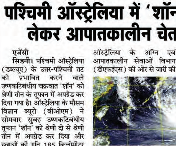
ऑस्ट्रेलिया के अग्नि एवं आपातकालीन सेवाओं विभाग (डीएफईएस) की ओर से जारी की गई एक आपातकालीन चेतावनी में कहा गया, आप खतरों में हैं और तुरंत कार्रवाई करने की आवश्यकता है। इसी बीच, निवासियों को सलाह दी गई है कि वे भवनों के सबसे मजबूत और सुरक्षित हिस्सों में रहें तथा खिड़कियों और दरवाजों से दूर रहें। मौसम विज्ञान ब्यूरो ने आज

और बंधकों को रिहाई पर सहमति जताई। गौरतलब है कि इससे पहले, नवंबर 2023 में एक सप्ताह के युद्ध विराम के दौरान भी 100 से ज्यादा बंधकों को रिहा किया गया था। इसके अलावा, इस्राइल रक्षा बल के प्रवक्ता रिजर एडमिरल डैनियल हैगरी ने बताया कि यह तीन महिलाएं हमास की कैद से 471 दिनों के बाद वापस लौटी हैं और उन्हें और उनके परिवार को बधाई दी गई।