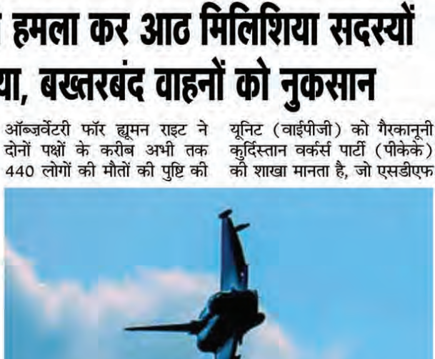
का मुख्य हिस्सा है। पीकेके को तुर्की, अमेरिका और यूरोपीय संघ की ओर से एक आतंकवादी संगठन के रूप में सूचीबद्ध किया गया है।