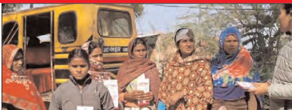
पुलिस टीम द्वारा क्षेत्र में, महिला थाना पुलिस टीम द्वारा क्षेत्र में* भ्रमणशील रहते हुए/चौपाल लगाकर/कार्यक्रम का आयोजन कर बच्चियों/छात्राओं/महिलाओं को नारी सुरक्षा, नारी सम्मान, नारी स्वावलम्बन कार्यक्रम के बारे में जागरूक किया गया तथा उनके प्रति होने वाले किसी भी अपराध एवं संबंधित अपराधियों के बारे में तत्काल पुलिस एवं शक्ति मित्र महिला पुलिसकर्मीयों