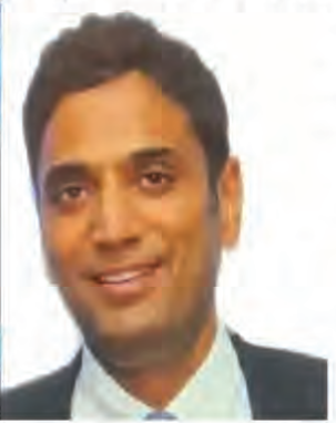
पीपीएसएल में डाउनस्ट्रीम निवेश के लिए सरकार से संपूर्ण मिली थी। इसके बाद कंपनी ने पीए लाइसेंस के लिए फिर से रिजर्व