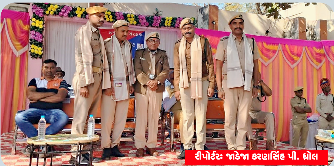
રીપોર્ટર: જાડેજા કરણસિંહ પી. ધોલ

રાજકોટ, તા. ૧૩: રેલવે તંત્ર જીવનું જોખમ રહેલું છે. આ દ્વારા બધા લોકોને જાણ કરવામાં ઉપરાંત સામાન્ય લોકો પણ આવે છે કે રાજકોટ ડિવિઝનના રેલવે ટ્રેક પાસે પતંગ ઉડાવે છે તમામ સેક્શનમાં રેલવે લાઈનો અને ઓવરહેડ વાયરમાંથી પતંગ પર ૨૫૦૦૦ વોલ્ટના ઓવરહેડ કાઢવાનો પ્રયાસ કરે છે. તો સૌને વાયરો લગાવવામાં આવ્યા છે. વિનંતી છે કે રેલવે ટ્રેક પાસે આ ૨૫૦૦૦ વોલ્ટના વાયરોમાં પતંગ ઉડાવવાનું ટાળો અને પતંગની દોરીઓ ફસાઈ હોવાનું રેલવેના હાઈ વોલ્ટેજ ટ્રેક્શન જોવામાં આવ્યું છે. રેલવે વાયરમાંથી પતંગ કાઢવાનો કર્મચારીઓએ ટ્રેક પર કામ કરતી પ્રયાસ ન કરે અને સામાજિક વખતે આ વાયરોના સંપર્કમાં ન હિતને ધ્યાનમાં રાખીને શક્ય આવે તેની કાળજી લેવી જોઈએ તેટલું અન્ય લોકોને આ કારણ કે ઈલેક્ટ્રિક શોકને કારણે બાબતની જાણ કરે.