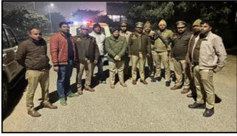
मोटरसाइकिल, जिस पर तीन व्यक्ति सवार थे, सामने से आते दिखाई दिए। पुलिस टीम ने उनको रोकने का इशारा किया। लेकिन वह नहीं रुके और तेज गति से मोटरसाइकिल को कैंपसूल गोल चक्कर की तरफ जाने वाली

ग्रेटर नोएडा (आरएनएस)। ग्रेटर नोएडा वेस्ट में थाना बिसरख पुलिस और तीन शांति लुटेरे बदमाशों के बीच बीती रात चेकिंग के दौरान मुठभेड़ हुई। जिनमें दो बदमाशों को गोली लगने के बाद और एक बदमाश को काबिज के दौरान गिरफ्तार किया गया। यह तीनों बदमाश पश्चिम बंगाल के रहने वाले हैं और लूट और चोरी के मामलों में पहले भी जेल जा चुके हैं। इनके पास से लूटे गए 9 मोबाइल, अवैध हथियार और चोरी की बाइक बरामद हुई है। पुलिस से मिली जानकारी के मुताबिक 8 जनवरी की देर रात थाना बिसरख पुलिस चौकी गौर सिटी-1 के सामने चार मूर्ति के पास बैरियर लगाकर चेकिंग कर रही थी। इसी दौरान एक