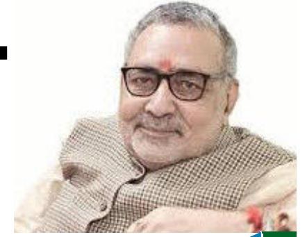
12 अना हजारे को धोखा दिया, केजरीवाल...