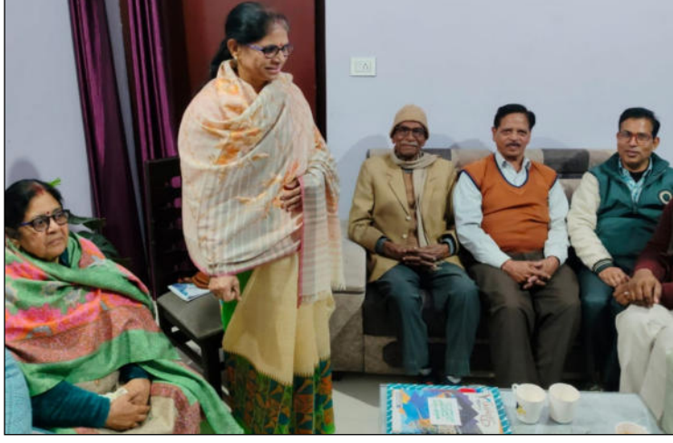
प्रेषित किया गए निर्देशानुसार इस आयोजन में जागरूकता पर आधारित प्रतियोगिताएं एवं विभिन्न प्रकार की राष्ट्रवादी राष्ट्रभक्ति जन गतिविधियां संपन्न होगी। इन प्रतियोगिताओं एवं