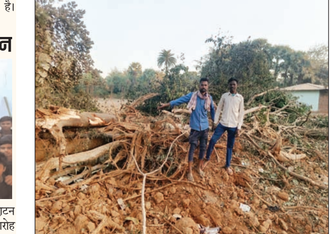
संवाददाता सरैयाहाट । नेशनल हाईवे 144ए को नेशनल हाईवे 133 से जोड़ने वाली निर्माणाधीन बेलदाहा नीमानाथ सड़क निर्माण कार्य में कार्य एजेंसी एमएस कंस्ट्रक्शन के

अधिग्रहण के उपयोग किया जा रहा है। इतना ही नहीं सड़क निर्माण कार्य करवा रही एजेंसी के द्वारा कई जगहों से गलत तरीके से मिट्टी का उठाव कर रही है। इस बाबत ग्रामीण अव विरोध जताने के मूड में नजर आ रहे हैं। जानकारी के अनुसार करोड़ों की लागत से बनने वाली करीब 50 किलोमीटर लंबी यह सड़क जरमुंडी प्रखंड के जमुआ गांव के नेशनल हाईवे 114ए से बेलदाहा, नीमानाथ, राजसिमरिया, जमजोरी, भुलुआ, केंदुआ होते हुए बनहेटी मोड़ के समीप नेशनल हाईवे 133 को जोड़ेगी।