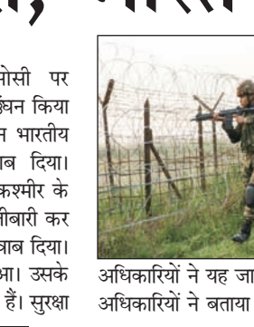
अधिकारियों ने यह जानकारी दी है। अधिकारियों ने बताया कि कृष्णा घाटी सेक्टर में

एजेंसी जम्मू। जम्मू-कश्मीर में एलओसी पर पाकिस्तानी सेना ने सीजफायर का उल्लंघन किया है। सीमा पार से गोलीबारी की लेकिन भारतीय सेना ने भी इसका मुंह तोड़ जवाब दिया। पाकिस्तानी सेना के जवानों ने जम्मू-कश्मीर के पुंछ जिले में नियंत्रण रेखा के पार गोलीबारी कर दी। इसका भारतीय सेना ने मुंहतोड़ जवाब दिया। इसमें पाकिस्तान को बड़ा नुकसान हुआ। उसके 6 जवान मारे गए हैं कई घायल भी हुए हैं। सुरक्षा