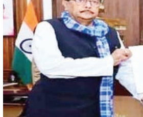
रांची। वहां कोई व्यवस्था नहीं होने तथा दरखाज-रिजुक्की नहीं होने का उल्लेख किया। कई कमियों के बावजूद उक्त भवन, विश्वविद्यालय की ओर से