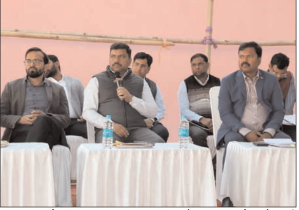
आवश्यक निर्देश दिया। भवन निर्माण विभाग द्वारा जानकारी दी गयी कि रंग रोमन का कार्य किया जा रहा है। सभी कार्य को ससमय पूरा कर लिया जाएगा। पूरे मेला परिसर में 4 हाई मास्ट लाइट अधिग्रहित कर दिया गया है। उपायुक्त ने निर्देश दिया कि मेला