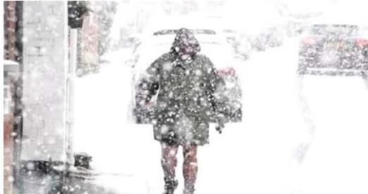
लंदन को 30 से 50 सेंटीमीटर तक बर्फ गिर सकती है जिससे यातायात बाधित हो सकता है। ठंड के कारण शीतलहर और दिल के दौर जैसी स्वास्थ्य समस्याओं की वजह से कई लोगों की जान जा चुकी है। सड़क दुर्घटनाओं में भी मौतें हो रही हैं, क्योंकि 'बर्फानी' के कारण सड़कें फिसलन भरि हो गई हैं।

न्यूयार्क/लंदन, एजेंसी। मौसम जाते-जाते दुनिया भर में मौसम का मिजाज बिगड़ा रहा है। ब्रिटेन में मौसम विभाग ने भारी बर्फानी और बारिश की चेतावनी जारी की है, जबकि अमेरिका में भीषण ठंड की वजह से अब तक 9 लोगों की मौत हो चुकी है। स्कॉटलैंड समेत ब्रिटेन के कई इलाकों में तापमान माइनस 6.6 डिग्री सेल्सियस तक गिर चुका है, और आने वाले दिनों में झल्लात और खराब हो सकते हैं। अमेरिका में भी शीत का कहर जारी है। देश के कई हिस्सों में जबरदस्त हिमपात और शीतलहर की वजह से अब तक 9 लोगों की मौत हो चुकी है।