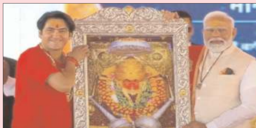
जो धर्म और संस्कृति प्रगतिशील है, उस पर हमला करने का साहस करते हैं। बागेश्वर धाम में आपको भजन, भोजन और स्वस्थ जीवन का आशीर्वाद मिलेगा: पीएम ने कहा

पीएम मोदी ने कहा, 'जो लोग गुलामी की मानसिकता में पड़ गए हैं वे हमारी आस्था, मान्यताओं और मंदिरों, हमारे धर्म, संस्कृति और सिद्धांतों पर हमला करते रहते हैं। ये लोग हमारे त्योहारों, परंपराओं और रीति-रिवाजों का दुरुपयोग करते हैं। हमारे समाज को बांटना और उसकी एकता को तोड़ना उनका एजेंडा है। धीरे-धीरे शास्त्री लंबे समय से देश में एकता के मंत्र से लोगों को अवगत करा रहे हैं। अब उन्होंने इस कैंसर संस्थान के निर्माण की योजना बनाई