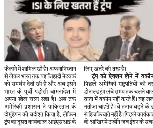
फैलाने में शामिल रही है। अफगानिस्तान से लेकर भारत तक यह जिहादी नेटवर्क को समर्थन देती रही है और अब इसने भारत के पूर्वी पड़ोसी बांग्लादेश में अपना खेल चला रखा है। अब तक अमेरिकी प्रशासन ने पाकिस्तान के दोम्हरेपन को बर्दाश्त किया है, लेकिन ट्रंप का दूसरा कार्यकाल आईएसआई के

लोक तंत्र की आवाज वाशिंगटन। पाकिस्तान की सेना लंबे समय से अमेरिका के साथ डबल गेम खेलती रही है। एक तरफ वह आतंकवाद से लड़ाई के नाम पर पाकिस्तान के अंदर अमेरिका से अरबों डॉलर आते रहे, दूसरी तरफ पाकिस्तानी सेना की खुफिया एजेंसी आईएसआई उसी पैसे से आतंकी गुटों को पालती रही, जो अमेरिका के ही खिलाफ लड़ते रहे। लेकिन अब आईएसआई के ऐसा करने के दिन लौट गए हैं, क्योंकि अमेरिकी राष्ट्रपति डोनाल्ड ट्रंप उसकी रण-रण से वाकिफ हो चुके हैं। पाकिस्तान की आईएसआई लंबे समय में दक्षिण एशिया में अस्थिरता