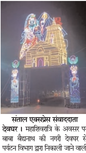
संताल एक्सप्रेस संवाददाता देवघर। महाशिवरात्रि के अवसर पर बाबा बैद्यनाथ की नगरी देवघर से पर्यटन विभाग द्वारा निकाली जाने वाली

भव्य शिवबारात की तैयारी अपने अंतिम चरण में है। ऐसे में सम्पूर्ण मेला क्षेत्र व देवघर शहर में रां-विरोगे स्पॉइल लाईट से सुसज्जित विद्युत पोल की सुंदरता परस्पर लोगों का ध्यान अपनी ओर आकर्षित कर रही है। सिर्फ इतना ही नहीं इसकी सुन्दरता रात्रि के समय देखने से ऐसा लगता है मानो किसी समारोह या उत्सव में पहुंचे हों। इसके अलावा बाबा मंदिर के आसपास के क्षेत्रों के अलावा सम्पूर्ण शिवबारात स्टेडियम और देवघर शहर के अन्य जगहों पर इन लाईटों को जगमगाते हुए आसानी से देखा जा सकता है। जिला प्रशासन द्वारा महाशिवरात्रि और शिवबारात के