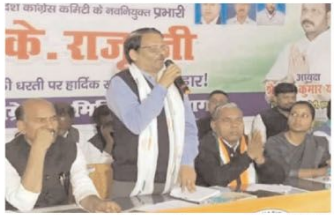
मजबूती से लागू किया जाएगा। बैठक में निर्णय लिया गया कि सभी कांग्रेस विधायक महीने में एक बार कार्यकर्ताओं और प्रशासन के साथ बैठक करेंगे। इसके अलावा, चार मंत्रियों को भी अलग-अलग जिम्मेदारियां सौंपी गई हैं, जिससे संगठन को मजबूत किया जा सके। यह बैठक पार्टी की 100वीं जयंती के धार देने और चुनावी कमजोरियों को दूर करने के उद्देश्य से की गई थी।