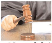
जांच में खुलासा हुआ कि महिला के साथ पहले गैरिपरी किया गया और फिर गला रेतकर हत्या कर दी गई। शव की पहचान छिड़ककर जला दिया गया।