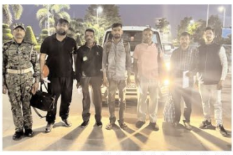
राज्य श्रमिकों से संपर्क किया है। श्रमिकों ने बताया कि वे जयप्रकाश एग्रीसोल्स डेव्लपमेंट अंड इंफ्रास्ट्रक्चर्स लिमिटेड के निर्माणधीन टनल में फंसे हुए हैं।