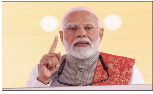
जब एक राष्ट्र की चेतना जागृत होती है, जब वह सैकड़ों साल की गुलामी की मानसिकता को बंधनों को तोड़कर नव चेतन्य के साथ हवा में सांस लेने लगता है, तो ऐसा ही दृश्य उपस्थित होता है, जैसा हमने 13 जनवरी के बाद

एजेंसी नई दिल्ली। प्रधानमंत्री नरेन्द्र मोदी ने प्रयागराज में संपन्न हुए महाकुंभ को बृहस्पतिवार को युग परिवर्तन की आहट करार दिया और कहा कि इस आयोजन ने भारत की विकास यात्रा के नए अध्याय का संदेश दिया है और यह संदेश है विकसित भारत का।