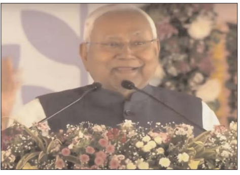
गए हैं तो सिर्फ यहां का नहीं, बल्कि पूरे बिहार का विकास

मुख्यमंत्री नीतीश कुमार ने कहा कि पीएम मोदी के नेतृत्व में देश का विकास हो रहा है, वहीं बिहार के विकास में भी सहयोग मिल रहा है। बजट में बिहार में मखाना बोर्ड, ग्रीनफिल्ड एयरपोर्ट की स्थापना, पश्चिमी कोसी नगर के लिए वित्तीय सहायता, प्रसंस्करण संस्थान की स्थापना का ऐलान किया गया है। मुख्यमंत्री नीतीश कुमार ने कहा कि पीएम मोदी यहाँ आ