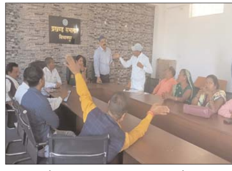
पंसस की बैठक आयोजित की गई थी। बैठक में कहा