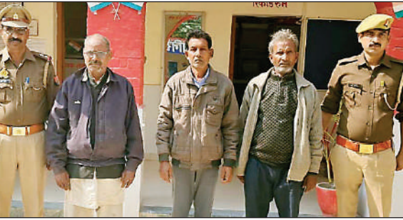
सरायमीर थाने में गिरफ्तार अभियुक्त।