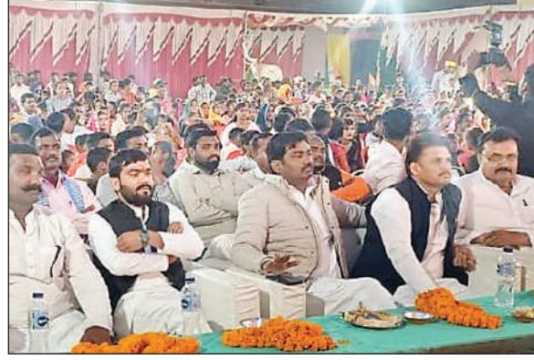
कार्यक्रम में मंचासीन अतिथिगण

हमें समाज की शिक्षित एवं संस्कारित बनाने के लिए निरंतर प्रयासरत रहना चाहिए। कार्यक्रमों से छात्रों में छिपी हुई प्रतिभा को निखारना आसान होता है। इस दौरान बच्चों ने रंगारंग कार्यक्रम