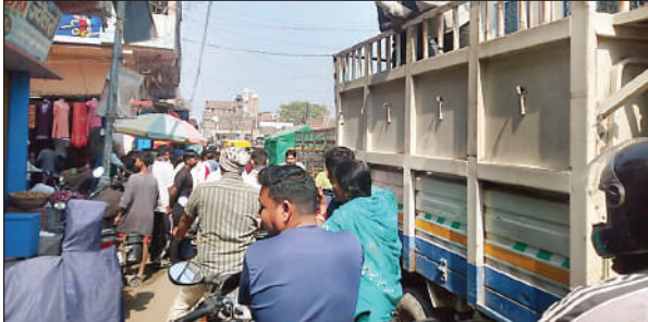
बैरिया में जाम में फंसे लोग।

बैरिया (बलिया)। जाम की समस्या बैरिया में लोगों के नाक में दम कर दिया है। आए दिन जाम के झाम में फंसा बैरिया के लोगों को आवागमन में काफी मुश्किलों का सामना करना पड़ रहा है। रविवार को वाहनों की तो बात दूर जाम इस कदर लगा कि पैदल भी आना जाना कठिन हो गया। जिम्मेदार लोग मूक दर्शक बने हुए हैं। जबकि आम जनता जाम के चलते काफी परेशान है। उल्लेखनीय है कि बैरिया बाजार से अतिक्रमण हटाने का नाम नहीं ले रहा है। अतिक्रमण हटाने को लेकर स्थानीय प्रशासन केवल कोम पुत्र कर रहा है। आज अतिक्रमण हटाय जा रहा है, और दूसरे ही दिन लोग अतिक्रमण पुनः कर ले रहे हैं। ऐसे में प्रशासन अतिक्रमणकारियों के खिलाफ कठोर कार्रवाई क्यों नहीं करता। यह चर्चा का विषय बना हुआ