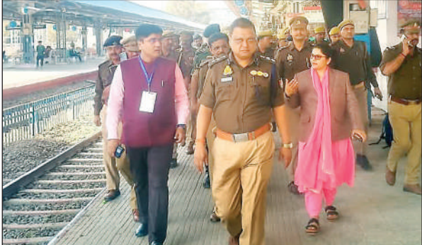
निरीक्षण करते आयुक्त व आईजी, डीएम व एसपी।

10 फरवरी से कार्यक्रम का आयोजन किया गया जिसमें संगत ने हिस्सा लिया। इस दौरान तीन अखंड पाठ की लड़ियां रखी गईं। जिनाक भव्य समापन 16 फरवरी रविवार को किया गया। 7 दिन से लगातार भजन