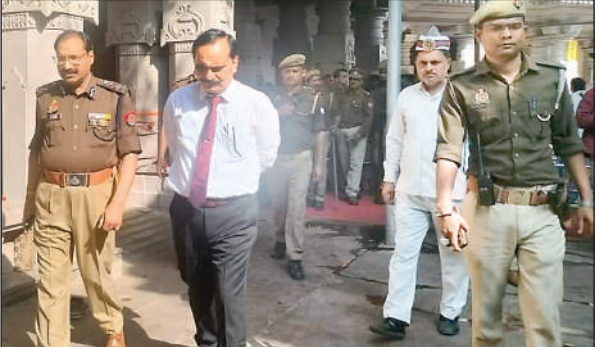
निरीक्षण करते आयुक्त व आईजी, डीएम व एसपी।

भीड़ को देखते हुए मंडलायुक्त बालकृष्ण त्रिपाठी तथा पुलिस महानिरीक्षक आर०पी०सिंह ने मेला क्षेत्र का निरीक्षण किया। वही रविवार को