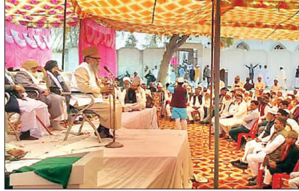
कादरिया नूरिया दीक्षान्त समारोह को सम्बोधित करते वक्ता