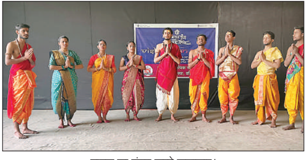
नाटक का मंचन करते कलाकार।

बलिया। राष्ट्रीय नाट्य विद्यालय दिल्ली द्वारा आयोजित भारत रंग महोत्सव के अवसर पर आयोजित विश्व जग रंग महोत्सव का आयोजन किया गया। इसमें देश की दो हजार से अधिक संस्थाओं ने एक साथ एक ही नाटक का आनलाइन प्रदर्शन कर बनाया विश्व रिकॉर्ड। बलिया से संकल्प साहित्यिक, सामाजिक एवं सांस्कृतिक संस्था की भागीदारी रही।