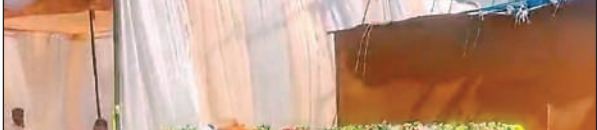
बाउंड्रीवॉल का शिलान्यास

चुनार। नगर पालिका अंतर्गत चकईपुर मोहाना स्थित परेड ग्राउंड के बांडड़ी वाल के निर्माण कार्य का रविवार को मुख्य अतिथि क्षेत्रीय विधायक अनुराग सिंह ने भूमि पूजन कर शिलापट्टं का अनावरण किया। पं० दीन दयाल उपाध्याय नगर विकास योजना अंतर्गत एक करोड़ 95 लाख की लागत से निर्माण कार्य कराया जाएगा। शिलान्यास कार्यक्रम में विशिष्ट अतिथि के रूप में उपस्थित पालिकाध्यक्ष मंसूर अहमद ने विधायक के कार्यों की सराहना करते हुए कहा कि बाउंड्रीवाल के निर्माण कार्य से नगर को सम्मान मिला है, इसके लिए उन्होंने नगर की जनता की ओर से विधायक के प्रति आभार जताया।