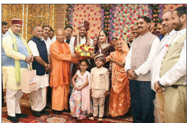
वर वधू को आशीर्वाद देते मुख्यमंत्री योगी आदित्यनाथ और अन्य परिजन।