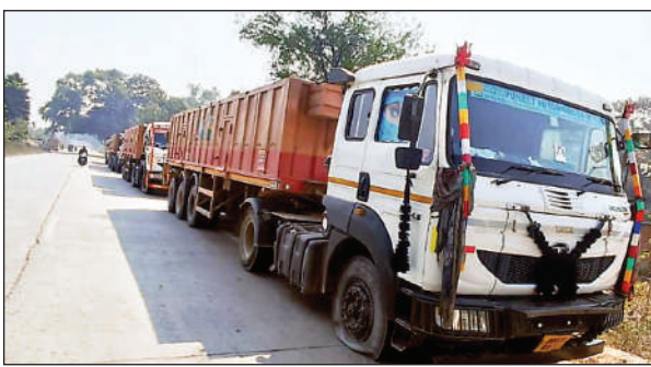
एसडीएम के द्वारा पकड़ा गया ओवरलोड बालू लदा ट्रेलर।