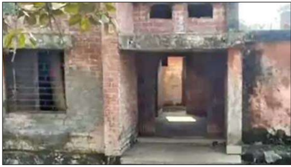
जर्जर पड़ा शौचालय।