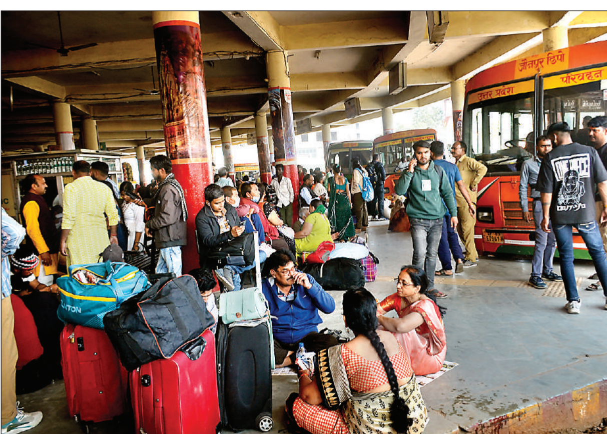
वाराणसी में रविवार को रोडवेज बस स्टेशन पर भी यात्रियों की रही भीड़।