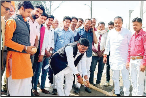
फावड़ा चलाकर सड़क चौड़ीकरण का शुभारंभ करते राज्यमंत्री