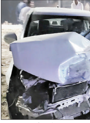
दुर्घटना में क्षतिग्रस्त कार।

माहुल(आजमगढ़)। अहरोला थाना क्षेत्र के स्थानीय नगर से फुलवरिया जाने वाली सड़क पर शनिवार देर रात