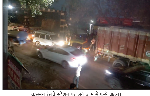
कुछमन रेलवे स्टेशन पर लगे जाम में फंसे वाहन।