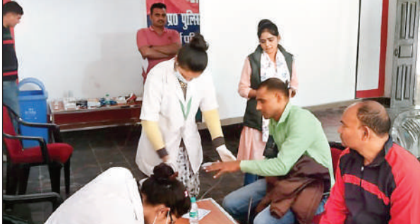
पुलिस कर्मियों का स्वास्थ्य परीक्षण करते चिकित्सक।