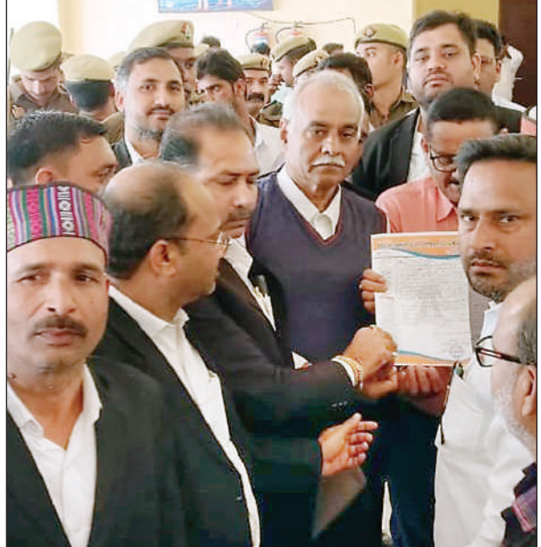
कलेक्ट्रेट में प्रशासनिक अधिकारी को ज्ञापन सौंपते अधिवक्ता।