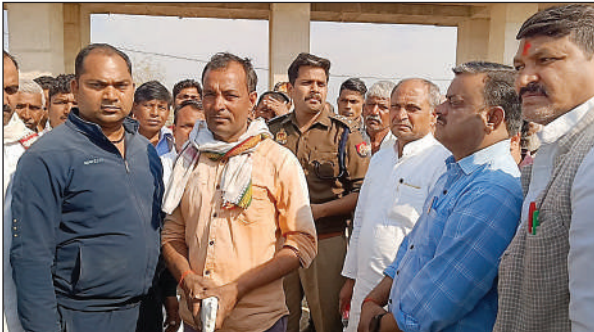
घटना के बाद मौके पर जुटी पुलिस व सपा के नेतागण।

डीडीयू नगर। मुगलसराय कोतवाली क्षेत्र के हदयपुर गांव में मंगलवार की सुबह साढ़े आठ बजे हाइड्रा की चपेट में आने से खेत से घर लौट रहे साइकिल सवार किसान की मौत हो गई। घटना के बाद हाइड्रा चालक मौके से भाग गया। मौके पर पहुंचे ग्रामीणों ने हाइड्रा के आगे शव को रखकर मुआवजा की मांग पर अड़ गए। मुआवजा की मांग पर सात घंटे तक शव मौके पर पड़ा रहा। हंगामा को देखते हुए मुगलसराय कोतवाली पुलिस मौके पर पहुंच गई। हदयपुर गांव में डीएफसीसी (डेडिकेटेड फ्रेट कार्रिडोर कोरपेरेशन) का फ्लाई ओवर का