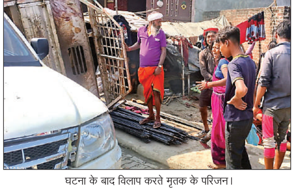
घटना के बाद विलाप करते मृतक के परिजन।