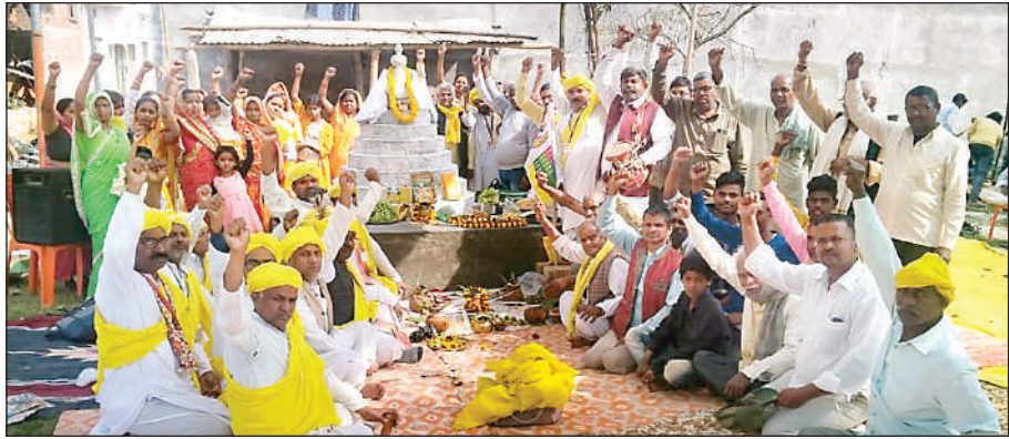
प्रकृति शक्ति फड़ापने बड़ादेव में प्रतीक चिह्न की स्थापना करते गौड समाज के लोग