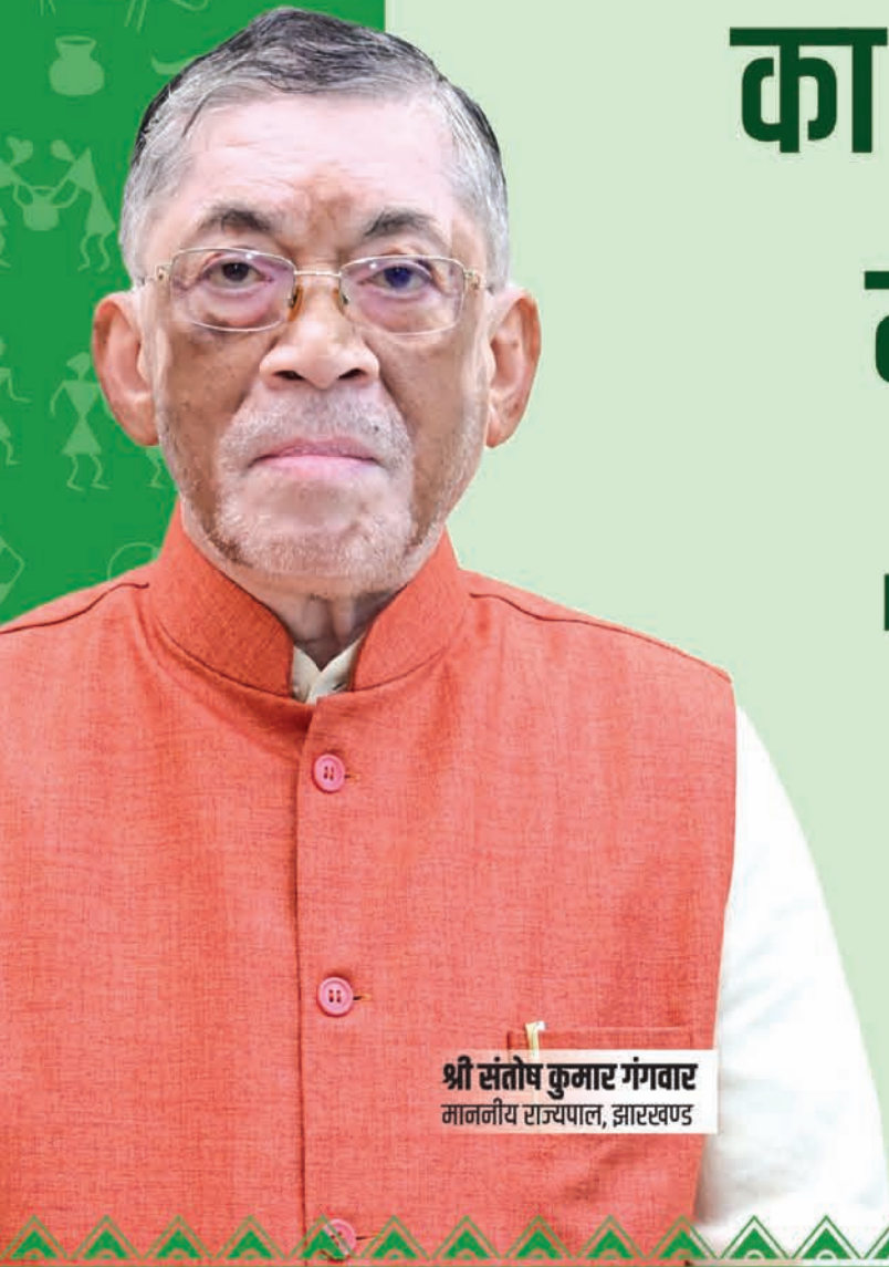
श्री संतोष कुमार गंगवार माननीय राज्यपाल, झारखण्ड