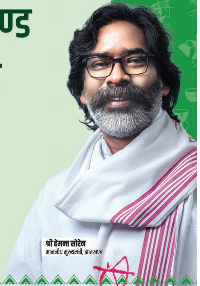
श्री हेमन्त सोरेन माननीय मुख्यमंत्री, झारखण्ड