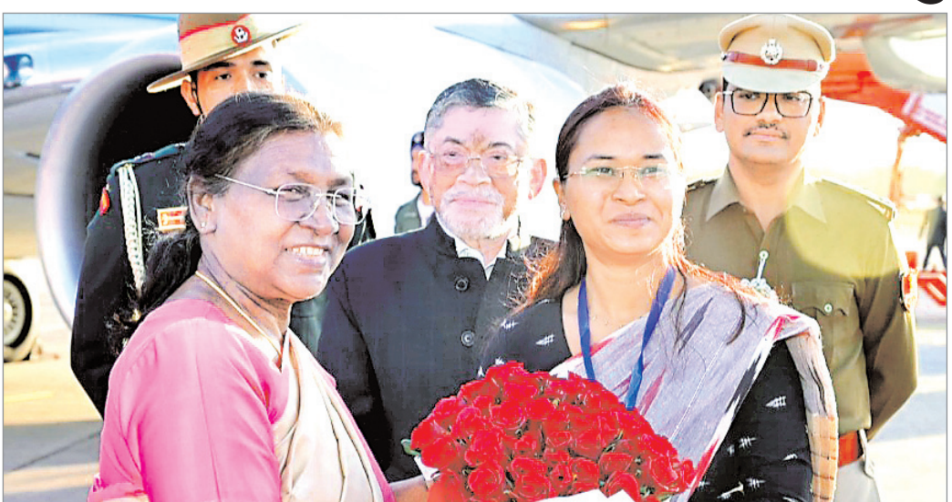
फरवरी) को दिन में 11:00 बजे रांची के टेकनोलॉजी (बीआईटी) के प्लैटिनम में भाग लेंगी। वह संस्थान के मेसरा स्थित बिरला इंस्टीट्यूट ऑफ जुबली समारोह में मुख्य अतिथि के रूप में आइंटोरियम में आयोजित रिसर्च