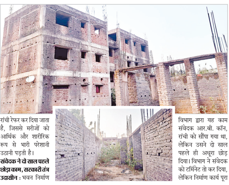
रांची रेफर कर दिया जाता है, जिससे मरीजों को आर्थिक और शारीरिक रूप से भारी परेशानी उठानी पड़ती है। संवेदक ने दो साल पहले छोड़ा काम, सरकारी तंत्र उदासीन : भवन निर्माण

नवीन मेल संवाददाता डुमरी (गुमला)। सरकार के बड़े-बड़े दावों के बावजूद डुमरी प्रखंड मुख्यालय के समीप 30 शैथ्या वाले सामुदायिक स्वास्थ्य केंद्र (सीएचसी) का निर्माण पांच वर्षों से अधर में लटक हुआ है। 10.17 करोड़ रुपये की लागत से शुरू हुई यह परियोजना अब महज एक खंडहर बनकर रह गई है। जिले के तीन उपायुक्तों ने निरीक्षण किया, लेकिन उनका तबादला हो गया और अस्पताल का निर्माण कार्य ठप पड़ा रह गया। स्वास्थ्य सुविधा के नाम पर सिर्फ ढांचा, मरीज बेहल : डुमरी प्रखंड के हजारा लोग आज भी बुनियादी चिकित्सा सुविधाओं से वंचित हैं। सरकार जहां स्वास्थ्य सेवाओं को सुदृढ़ करने की बात करती है, वहीं इस अस्पताल की स्थिति सरकार के दावों की पोल खोल रही है। स्थानीय लोगों को इलाज के लिए गुमला या