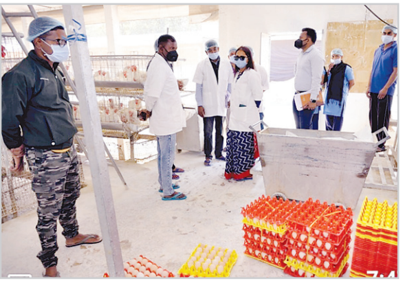
अधिकारी नियुक्त कर इसे पूरे झारखंड में बढ़ावा देने का भरसा दिया। बसिया में महिला समिति की सदस्यों और अन्य किसानों का काम से प्रभावित मंत्री ने अंडा उत्पादन और मुर्गी पालन से जुड़ी महिला समिति