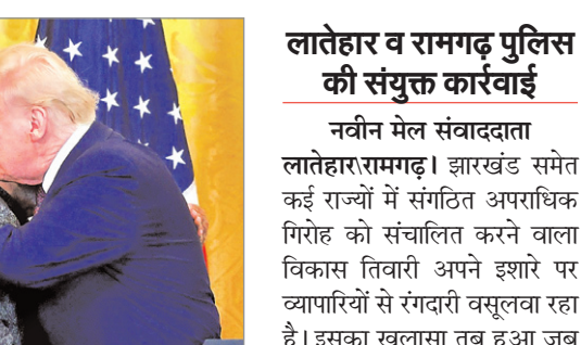
ही, नए लक्ष्यों को प्राप्त करने का संकल्प भी था। हम मानते हैं कि भारत और अमेरिका का साथ और सहयोग एक बेहतर विश्व को आकार दे सकता है। ये अंश संयुक्त राज्य अमेरिका की राजधानी वाशिंगटन डीसी में भारत-अमेरिका संयुक्त संवाददाता सम्मेलन में प्रधानमंत्री शेष पेज 09 पर

वाशिंगटन (एजेंसी)। भारत के प्रधानमंत्री नरेंद्र मोदी ने कहा है कि अमेरिका के राष्ट्रपति डोनाल्ड ट्रंप ने भारत और अमेरिका के संबंधों को अपने नेतृत्व में संजोने के साथ जीवंत बनाया है। उन्होंने कहा, जिस उस्ताह से उनके पहले दो में हमने मिलकर काम किया, वही उस्ताह, वही उर्जा और वही प्रतिबद्धता मैंने आज भी महसूस की। आज की चर्चा के केंद्र में उनके पहले दो में हमारी उपलब्धियों का संतोष और गहरे आपसी विश्वास का सेतु था। साथ