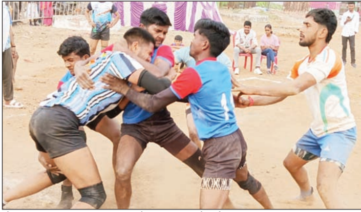
से परास्त कर तथा पुरुष वर्ग में एसपी खो खो- महिला वर्ग का खिताब करबिधा कालेज दुमका ने देवघर को 41-27 से परास्त कर खिताब पर कब्जा कर लिया।