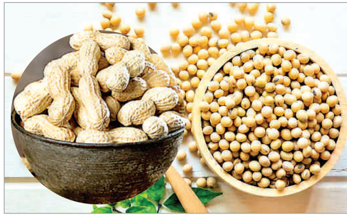
एलएमटी सोयाबीन की खरीद की गई है, जिससे 8,46,251 किसान लाभान्वित हुए हैं। चौहान ने किसानों के हित में महाराष्ट्र में खरीद की अवधि 90 दिनों की सामान्य खरीद अवधि को 24 दिनों के लिए और तेलंगाना में 15

स्थिरीकरण निधि (पीएसएफ) जैसे विभिन्न घटक शामिल हैं। केंद्रीय मंत्री चौहान ने सोमवार को मंत्रालय में मीडिया से कहा कि पीएम आशा योजना का उद्देश्य किसानों को उनकी उपज के लिए लाभकारी मूल्य देने के साथ-साथ उपभोक्ताओं को सस्ती कीमतों पर आवश्यक वस्तुओं की उपलब्धता सुनिश्चित करना है। पीएसएस के तहत सोयाबीन और मूंगफली की खरीद के लिए छत्तीसगढ़, गुजरात, कर्नाटक, मध्य प्रदेश, महाराष्ट्र, राजस्थान और तेलंगाना में सोयाबीन की खरीद को मंजूरी दी है। नौ फरवरी तक 19.99