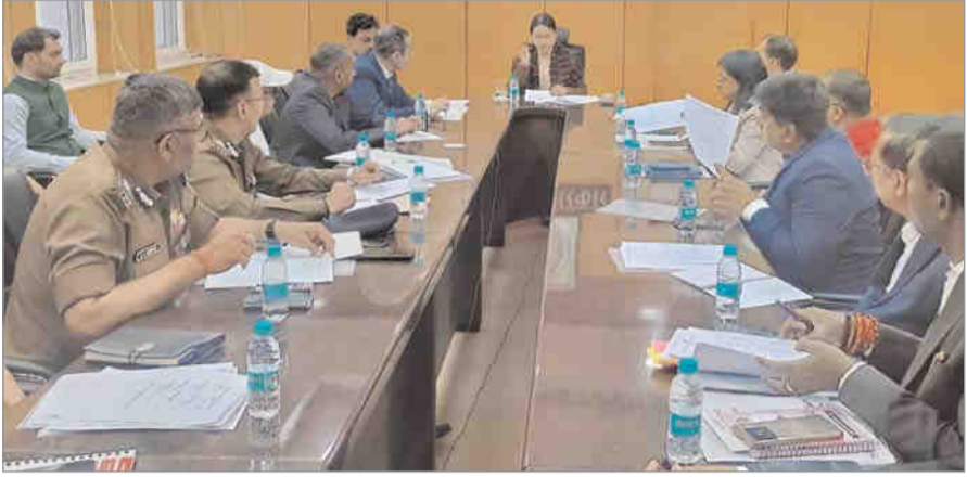
तैयारियों को पुख्ता करें। समीक्षा के दौरान मुख्य सचिव ने आबाध विद्युत आपूर्ति के निर्देश दिये। वहीं, एयरपोर्ट के निदेशक को हवाई अड्डा पर वीआईपी लाउंज को व्यवस्थित रखने को कहा। इस दौरान राष्ट्रपति के मिनट टू मिनट कार्यक्रम के अनुसार अलग-अलग व्यवस्था के लिए सम्बन्धित विभागों के अधिकारियों को तैयारियों का भी जायजा लिया गया। राष्ट्रपति के आगमन के दौरान स्वागत के लिए बुके की व्यवस्था, राष्ट्रीय गान, कारकेड, सुरक्षा व्यवस्था, भोजन और आवासन की व्यवस्था, विद्युत और ध्वनि विस्तारकी व्यवस्था, कार्यक्रम स्थल और आवासन स्थल पर मेडिकल व्यवस्था, अग्निशमन व्यवस्था, आवागमन मार्ग को दुरुस्त करना सहित कई अन्य जरूरी व्यवस्था की तैयारियों की समीक्षा की गयी।

फ्रीडम फाइटर संवाददाता रांची : राष्ट्रपति द्रौपदी मुर्मू दो दिवसीय दौरे पर 14 फरवरी को रांची आ रही हैं। वह 15 फरवरी को वापस दिल्ली लौट जायेंगी। इस दौरान वह बीआईटी मेसरा के प्लैटिनम जुबली कार्यक्रम में हिस्सा लेंगी। उनके रांची आगमन पर तैयारियों को लेकर मुख्य सचिव अलका निवारी की अध्यक्षता में समीक्षा की गयी। मुख्य सचिव ने अधिकारियों को निर्देश दिये कि प्रोटोकॉल के अनुसार राष्ट्रपति के दौरा के दौरान पूरी व्यवस्था चाक-चौबंद रखें। जहाँ जरूरी हो, विभाग एक-दूसरे से समन्वय बना कर