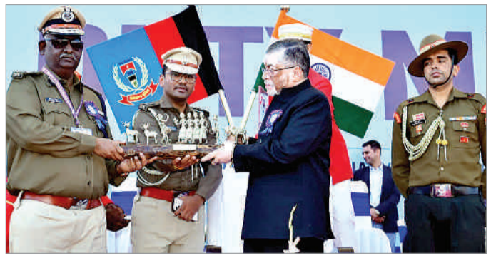
राज्यपाल ने कहा कि वर्तमान समय में साइबर अपराध, वित्तीय धोखाधड़ी, मानव तस्करी और संगठित अपराध जैसे चुनौतियां बढ़ रही हैं। इनसे प्रभावी ढंग से निपटने के लिए पुलिस बल को अत्याधुनिक तकनीकों और विशिष्ट

का निर्वहन करते हैं। उनका यह बलिदान, त्याग एवं सेवा की भावना सभी को प्रेरित करते रहेंगे। राज्यपाल सोमवार को रांची के खेलगांव स्थित मरांग गोमके जयपाल सिंह स्टेडियम में आयोजित 68वें अखिल भारतीय पुलिस ड्यूटी मीट-2025 के उद्घाटन समारोह में बतौर मुख्य अतिथि बोल रहे थे। उन्होंने कहा कि ऐसे आयोजन न केवल पुलिस बल की कार्यकुशलता को प्रदर्शित करते हैं, बल्कि आपसी सहयोग, नवीन तकनीकों के आदान-प्रदान और पुलिसकर्मियों के मनोबल को बढ़ाने का अवसर भी प्रदान करता है।