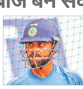
अधिक से अधिक रन बनाने की उम्मीदें रहेंगी। विराट अपनी चौथी चैम्पियंस ट्रॉफी खेल रहे हैं। विराट ने अब तक 13 मैचों में 529 रन बनाए हैं और इस प्रकार वह भारतीय टीम के चौथे सबसे ज्यादा रन बनाने वाले बल्लेबाज हैं। उन्हें चैम्पियंस ट्रॉफी में भारत के सफल बल्लेबाज

बनने के लिए केव 173 रन चाहिये। अभी शिखर धवन के नाम चैम्पियंस ट्रॉफी में सबसे अधिक रन हैं, जिन्होंने 2013 और 2017 की चैम्पियंस ट्रॉफी में कुल 701 रन बनाए थे। धवन दोनों चैम्पियंस ट्रॉफी में सबसे ज्यादा रन बनाने वाले बल्लेबाज रहे थे। भारत ने 2013 में ट्रॉफी जीती थी जबकि 2017 में टीम फाइनल तक पहुंची थी। वहीं पूर्व कप्तान सौरव गांगुली 665 रन के साथ दूसरे स्थान पर हैं, जिन्होंने 2000 और 2002 में चैम्पियंस ट्रॉफी खेले थे। विराट ने चैम्पियंस ट्रॉफी में 12 पारियों में 529 रन बनाए हैं, जिसमें पांच अर्धशतक भी शामिल हैं।