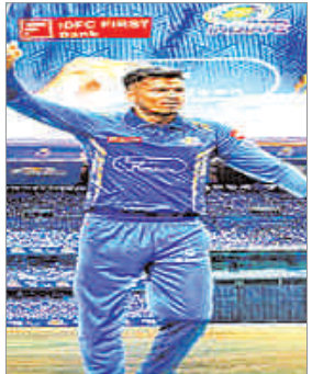
स्वस्थ होने की कामना की। फ्रेंचाइजी ने कहा कि पलटन आपके जल्दी स्वस्थ होने की कामना करती है। हमें उम्मीद है कि हम आपको जल्द ही मैदान पर खेलते देखेंगे। आंकड़ों की बात करें तो 23 वर्षीय खिलाड़ी मुजीब ने 256 टी20 में 6.75 की इकॉनमी से 275 विकेट लिए हैं।

एजेंसी मुंबई : पांच बार की चैम्पियन मुंबई इंडियंस ने अफगानिस्तान के स्पिनर मुजीब उर रहमान को टीम में शामिल करने की घोषणा है। मुजीब को हमवतन अल्लाह गजनफर के रिप्लेसमेंट के रूप में टीम में जगह दी गई है। गजनफर चोट के कारण इंडियन प्रीमियर लीग (आईपीएल) 2025 से बाहर हो गए हैं। आईपीएल मेगा नीलामी में मुंबई इंडियंस ने गजनफर को 4.80 करोड़ रुपये में खरीदा था। मुंबई इंडियंस ने रविवार को एक बयान में कहा कि दाएं हाथ के मिस्ट्री स्पिनर मुजीब, ब्लू एंड गोल्ड आर्मी में हमारे परिवार में नए सदस्य होंगे, जो दुनिया भर में अपनी शानदार स्पिन गेंदबाजी के लिए मशहूर हैं। इसी के साथ मुंबई ने गजनफर के जल्दी