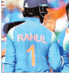
इनमें से भारतीय टीम दो ही जीत पायी है। वहीं पाकिस्तान ने ने तीन मैच जीते हैं। इसके अलावा उसने पिछली बार फखर जमां के शतक से 2017 में खेले गये इस टूर्नामेंट में खिताब भी जीता था। दोनों ही टीमों में उस समय के आधे खिलाड़ी अब भी हैं। ऐसे में भारतीय टीम इस बार उस हार का हिसाब बराबर करना चाहेगी। आईसीसी चैम्पियंस ट्रॉफी पहली बार 1998 में आयोजित हुई पर

एजेंसी मुंबई : आईसीसी चैम्पियंस ट्रॉफी में सभी को भारत और पाकिस्तान के बीच 23 फरवरी को होने वाले अहम मुकाबले का इंतजार है। दोनों ही टीमों को इसमें जीत का प्रबल दावेदार माना जा रहा है। अभी दोनों ही टीमों अच्छे फॉर्म में हैं। ऐसे में इनके बीच कड़े मुकाबले की उम्मीद है। आंकड़ों पर नजर डालें तो भारतीय टीम हमेशा ही आईसीसी टूर्नामेंटों में हावी रही है और वह केवल एक बार ही हारी है पर चैम्पियंस ट्रॉफी में पाकिस्तान की टीम को अधिक सफलता मिली है। उसने भारतीय टीम को 3 बार हराया है। ऐसे में टीम इंडिया को उसके खिलाफ मुकाबले में अपना सर्वश्रेष्ठ प्रदर्शन करना होगा। भारत और पाकिस्तान के बीच चैम्पियंस ट्रॉफी में अब तक 5 मुकाबले हुए हैं।