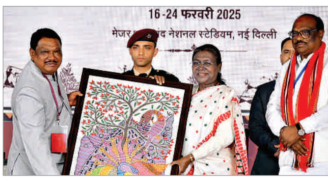
16-24 फरवरी 2025 मेजर ध्यानचंद नेशनल स्टेडियम, नई दिल्ली

खान-पान, वस्त्र और आभूषण, चिकित्सा पद्धतियाँ, धरेलू उपकरण तथा खेल-कूद हमारे देश की अनमोल धरोहर हैं। वे न केवल पारम्परिक हैं, बल्कि आधुनिक और वैज्ञानिक भी हैं। वे पर्यावरण के साथ एक प्राकृतिक सद्भाव प्रदर्शित करते हैं और एक स्थायी जीवन शैली का अनुकरण करते हैं। राष्ट्रपति ने कहा कि पिछले 10 वर्षों में आदिवासी समुदायों के व्यापक विकास के लिए कई प्रभावी कदम उठाये गये हैं। किसी भी समाज के विकास में शिक्षा की भूमिका सबसे अधिक महत्वपूर्ण होती है। यह प्रसन्नता की बात है कि देश में 470 से