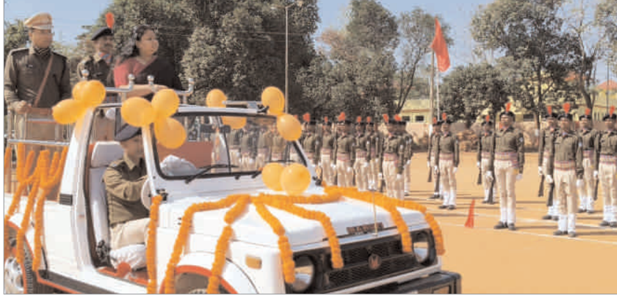
कमाण्डर को पुरस्कृत किया गया। क्षेत्रीय प्रशिक्षण केन्द्र, झारखण्ड गृह रक्षा वाहिनी, हजारीबाग में तब कुल 63 दिवसीय प्रशिक्षण दिया गया, जिसमें कुल 206 प्रशिक्षु गृह रक्षक (सभी गुमला