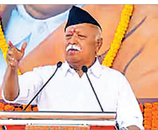
विदेशी ताकतें कर रही हैं भारत को तोड़ने का जिज्ञा

मोहन भागवत ने भारत पर हुए विदेशी आक्रमणों का जिज्ञा करते हुए कहा कि सिकंदर के समय से ही विदेशी ताकतें भारत को तोड़ने की कोशिश कर रही हैं। मुस्लिम लोग आते हैं, हमसे श्रेष्ठ नहीं होते, लेकिन हम पर शासन कर जाते हैं। इसका कारण आपसी फूट और गद्दारी है। यह इतिहास बार-बार दोहराया गया है और अब इसे रोकना होगा। राष्ट्रीय स्वयंसेवक संघ के सौ साल पूरे होनेवाले हैं। संघ का उद्देश्य केवल अपने स्वयंसेवकों को संगठित करना नहीं, बल्कि सम्पूर्ण हिन्दू समाज को एकजुट करना है। हम कोई पुरस्कार या प्रसिद्धि पाने के लिए यह कार्य नहीं कर रहे, बल्कि भारत के उत्थान में अपना योगदान देने के लिए कर रहे हैं। संघ के स्वयंसेवक बिना किसी स्वार्थ के कार्य करते हैं और यह उनके संस्कारों और विचारों का परिणाम है। हमारा काम समाज को संगठित करना और राष्ट्र निर्माण में योगदान देना है।