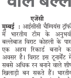
एजेंसी मुंबई : आईसीसी चैम्पियंस ट्रॉफी में भारतीय टीम के अनुभवी बल्लेबाज विराट कोहली के पास एक अहम रिकार्ड बनाने का अवसर है। विराट इस टूर्नामेंट में सबसे अधिक रन बनाने वाले शीप खिलाड़ी बन सकते हैं। भारतीय टीम 20 फरवरी को बांग्लादेश के खिलाफ चैम्पियंस ट्रॉफी में अपने अभियान की शुरुआत करेगी और दौरान सभी की नजरें विराट कोहली पर रहेंगी। विराट ने इंग्लैंड के खिलाफ तीसरे एकदिवसीय में अर्धशतक लगाकर फार्म हासिल कर लिया है। ऐसे में सभी को उनसे