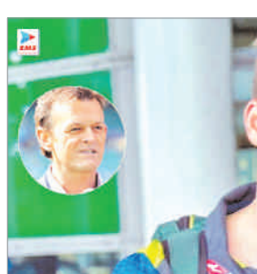
मेलबर्न : ऑस्ट्रेलियाई टीम के करिश्माई विकेटकीपर बल्लेबाज रहे क्रिकेटर एडम गिलक्रिस्ट ने कहा कि 19 फरवरी से होने वाली आईसीसी चैम्पियंस ट्रॉफी में कप्तानी कर स्टीव स्मिथ पारी की शुरुआत करें। गिलक्रिस्ट के अनुसार इससे स्मिथ को अधिक से अधिक

सकता है पर अभी स्मिथ को पारी शुरू करनी चाहिए क्योंकि शॉर्ट के पास अधिक अनभवज मिले हैं। उन्होंने कहा, मुझे मैच को बल्लेबाजी में हेड के साथ उतारना भी अच्छा प्रयोग लग रहा है। इससे बाएं हाथ और दाएं हाथ का अच्छा संयोजन बनेगा। वहीं स्मिथ भी पारी शुरू कर