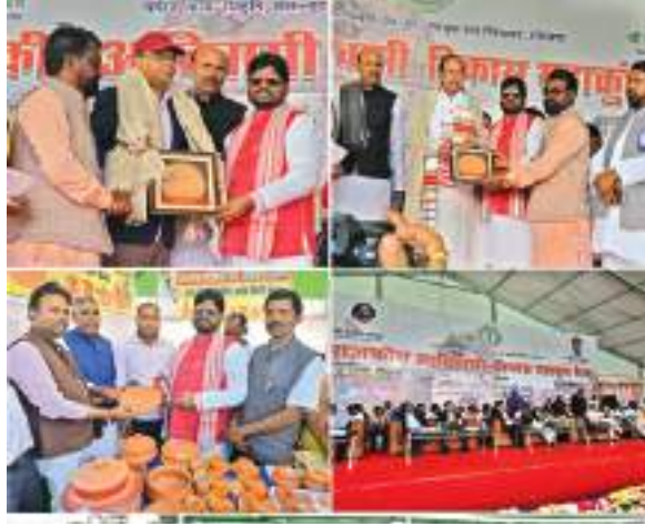
पलामू किला के निकट कुछ ही किमी की दूरी पर आदिवासियों के विकास के लिए सरकारी स्तर पर

मेदिनीनगर। आदिवासी शहीद लड़ाका वीर योद्धा राजा खानदान के वंशज आज जलालत के जिंदगी जीने पर मजबूर है। इस जलालत की जिंदगी से निकालने उबारने और बेहतर जिंदगी गढ़ने के लिए भारतीय संसद न जाने कितने पॉलिसी बनाए जो गिना नहीं जा सकता है। इन्हीं आदिवासियों में से एक महाप्रतापी राजा राजा मेदिनीराय हुए, जिनके शासन काल में दूध दही कि नदियां बहती थी, बावन गली तीरपन बाजार लगता था। कहावत प्रचलित है धनी- धनी राजा मेदनीयाँ घर -घर बजे मलहनियां। आज इन्हीं के याद में