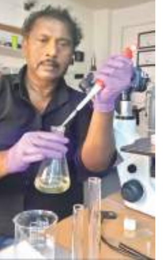
अलग पांच प्रमुख स्नान घाटों से खुद