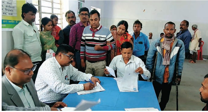
विभिन्न हल्का क्षेत्रों में शिविर का आयोजन किया गया। जहां खतियानी रैयत के उत्तराधिकारियों

एवं आपसी बंटवारा के आधार पर दाखिल झ खारिज के लिए आवेदन प्राप्त किए गए। शिविर में भूमि संबंधित अन्य समस्याओं का भी निराकरण संबंधित अंचल के अंचलाधिकारियों द्वारा किया गया। साथ ही अग्रतर कार्रवाई के लिए आवेदन प्राप्त किया गया। शिविर में काफी संख्या में आमजन शामिल हुए। वहीं, सोमवार से जिले में दिव्यांगता जांच - पेंशन शिविर का भी आयोजन शुरू हुआ। पहले दिन सामुदायिक स्वास्थ्य केंद्र गोमिया में शिविर का आयोजन किया गया है। जहां काफी संख्या में ग्रामीण आमजनों