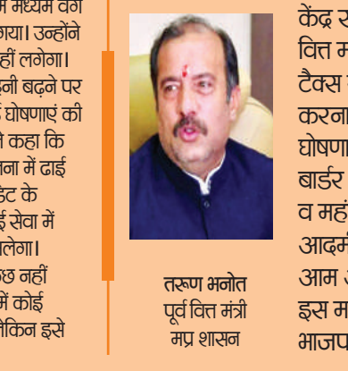
तरुण म्मनोत् पूर्व वित्त मंत्री मंत्र शासन