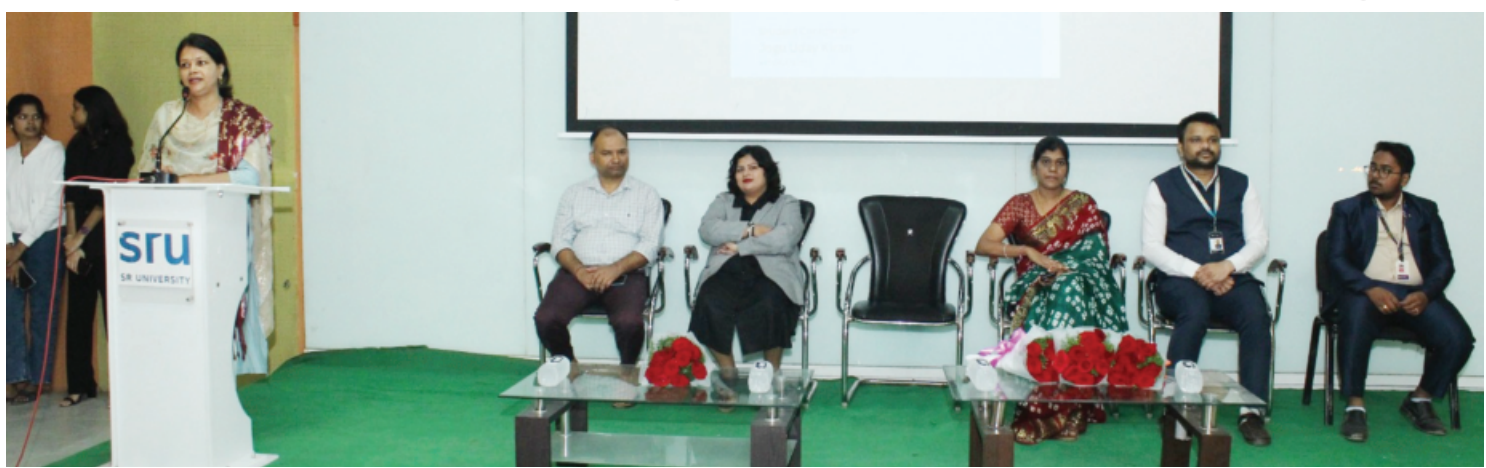
2025 Serves as a Launchpad for Young Innovators, Fostering a Culture of Problem-Solving and Entrepreneurship. The Participants' Enthusiasm and Ground-breaking Ideas Reflect Sr University's Commitment To Nurturing Talent.

As the Competition Progresses, More TeamS Will Continue to Showcase Their Creativity and Technical Expertise Over The Next Sessions. A Platform for Future Innovators The Sru Idea Conclave