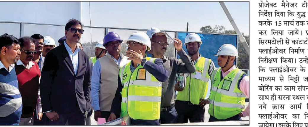
केबल स्टेबल ब्रिज एवं रेलवे लाईन के किनारे से निर्माण कार्य को बारीकी से देखा