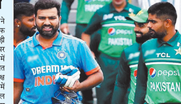
पाकिस्तान ने फाइनल में भारत को 180 रनों से हराकर बड़ी जीत दर्ज की थी। आठ टीमों के इस टूर्नामेंट में 15 मैच होंगे और ये मैच पाकिस्तान

कराची (पाकिस्तान) (एजेंसी)। पूर्व क्रिकेटर बासित अली ने चैंपियंस ट्रॉफी में आगामी ब्लॉकबस्टर मुकाबले में पाकिस्तान के खिलाफ भारत को पसंदीदा बताया है। भारत और पाकिस्तान के बीच कड़ी प्रतिद्वंद्विता का नया अध्याय 23 फरवरी को दुबई में क्रिकेट के मैदान पर होगा। चैंपियंस ट्रॉफी में पिछले पांच मंगा प्रतिद्वंद्विता मुकाबलों में पाकिस्तान 3-2 स्कोरलाइन के साथ भारत के खिलाफ आगे है। बासित ने आगामी मुकाबले के परिणाम का मूल्यांकन किया और भारत के पक्ष में परिणाम की भविष्यवाणी की, क्योंकि पाकिस्तान के मुकाबले बल्ले में पुरुषों के पास बहुत अधिक अनुभव है। बासित ने अपने यूट्यूब चैनल पर कहा, 70 प्रतिशत भारत और 30 प्रतिशत पाकिस्तान। भारत के पास अधिक अनुभवी टीम है। अगर विराट और रोहित फॉर्म में नहीं हैं, तो खेल बराबरी का होगा। चैंपियंस ट्रॉफी 2017 में अपने आखिरी मुकाबले में