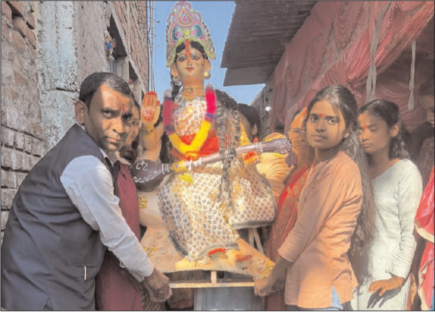
प्रातः नागपुरी टीम चरही/चूरचू। प्रखंड अंतर्गत सर्वोदय सरस्वती विद्या मंदिर उत्क्रमित मध्य विद्यालय परियोजना प्लस टू उच्च विद्यालय मध्य विद्यालय आदर्श हाई स्कूल में बड़ी धूमधाम से सरस्वती पूजा व हवन का कार्यक्रम संपन्न हुआ। जिसमें सभी विद्यार्थी द्वारा विधिवत पूजा अर्चना की गई।