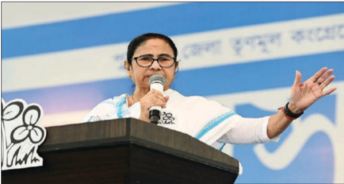
आकांक्षाओं को प्रतिबिंबित करेगा।