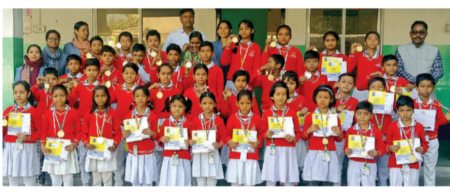
(एसओएफ) द्वारा किया जाता है। फाउंडेशन का उद्देश्य छात्रों में वैज्ञानिक सोच को बढ़ावा देना है। यह एक शैक्षणिक संगठन है जो विभिन्न प्रतियोगिताओं और ओलंपियाड के माध्यम से छात्रों

प्रातःनागपुरी प्रतिनिधि सिल्ली। चिराग नर्सरी स्कूल मुरी में साइंस ओलंपियाड फाउंडेशन के द्वारा आयोजित सामान्य ज्ञान की परीक्षा में अच्छे प्रदर्शन करने वाली गोल्ड मेडल व प्रस्तुति पत्र देकर सम्मानित किया गया। यह परीक्षा पिछले महीना आयोजित करने में सहयोग करें। उन्होंने कहा कि वैसे लोग जिनका मामला न्यायालय में लंबित है और वाद सुलहनीय है वह भी अपने-अपने वादों का निष्पादन कर सकेंगे।