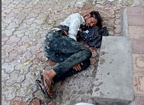
દાફ્ટિયાઓ રસ્તા પર પડ્યાપાથર્થા રહે છે: સ્થાનિક

મહિલાઓ માટે બહાર નીકળવું મુશ્કેલ બન્યું આ વિસ્તારમાં રહેતાં જિજ્ઞાસુને ખેતાણીએ જણાવ્યું હતું કે આ વિસ્તારમાં ઘણા સમયથી એક જ મુશ્કેલી છે કે દાફ્ટિયાઓ દાફ્ટિયા પીને સોસાયટીનાં મેઈન રોડ કે શેરી સહિતના સ્થળે ગમે ત્યાં સૂઈ જાય છે. તેઓ અર્ધનગ્ન હાલતમાં હોવાથી ઉઠાડતા પણ અમને શરમ આવે છે. આ સ્થિતિમાં પણ અમે જો તેમને ઊભા કરવાનો પ્રયાસ કરીએ તો જેમણે તેમ ગાળો બોલે છે. ગત વર્ષે દાફ્ટિયાઓ દરવાજો ખખડાવી દાફ્ટિયા પીવા માટે રૂપિયા માગતા હોવાનો વીડિયો શેર કર્યો હતો. એને કારણે પોલીસ પેટ્રોલિંગ વધારવામાં આવ્યું હતું અને સમસ્યા હળવી થઈ હતી. જોકે ફરી પોલીસ પેટ્રોલિંગ ઘટાડવામાં આવતાં એ જ પરિસ્થિતિ થઈ રહી છે, જેને કારણે સાંજ પછી મહિલાઓનું બહાર નીકળવું મુશ્કેલ બને છે. સ્થાનિક કોર્પોરેટરો અને ધારાસભ્ય સોસાયટીનાં બધાં ઇન્કશનમાં આવે છે. તેમને પણ ઘણીવાર રજૂઆત કરવામાં આવી છે, પણ તેમનાથી કાંઈ થતું નથી.