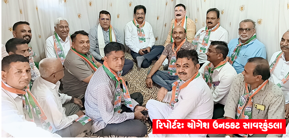
રિપોર્ટર: યોગેશ ઉનકડ સાવરકુંડલા

સાવરકુંડલા, તા. ૧૧: અમરેલી જિલ્લાની ચાર નગરપાલિકા સાથે અમરેલી, દામનગર અને સાવરકુંડલા નગરપાલિકાની પેટા ચૂંટણીમાં ચોજાઈ રહી છે ત્યારે સાવરકુંડલા નગરપાલિકા ના વોર્ડ નંબર ૩ ની પેટા ચૂંટણીમાં કોંગ્રેસ દ્વારા કાર્યાલયનું ઉદઘાટન પૂર્વ મંત્રી ધીરુભાઈ દૂધવાળા અને અમરેલી જિલ્લા કોંગ્રેસના પ્રમુખ પ્રતાપ દુધાત દ્વારા કરવામાં આવેલ હતું સાવરકુંડલાના વોર્ડ નંબર ૩ના મત વિસ્તારમાં કોંગ્રેસ ઉમેદવાર રમેશ