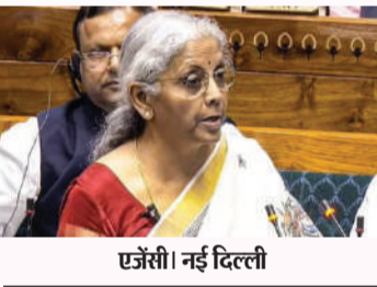
एजेंसी। नई दिल्ली

केंद्रीय वित्त मंत्री निर्मला सीतारमण ने गुरुवार को लोकसभा में बहुप्रतीक्षित नया आयकर विधेयक-2025 पेश कर दिया। नए आयकर विधेयक को सलेक्ट कमेटी के पास भेज दिया गया है। इसके साथ ही लोकसभा की कार्यवाही 10 मार्च सुबह 11 बजे तक के लिए स्थगित कर दी गई है। केंद्रीय वित्त मंत्री सीतारमण ने लोकसभा में नया आयकर विधेयक-2025 को पेश करते हुए कहा, "हम आयकर धाराओं की संख्या घटाकर 536 कर रहे हैं।" उन्होंने कहा कि आयकर विधेयक में अद्ययावत की संख्या में कमी के साथ-साथ महत्वपूर्ण बदलाव किए जा रहे हैं। उन्होंने बताया कि इस विधेयक का उद्देश्य 64 साल पुराने आयकर अधिनियम में बड़े पैमाने पर बदलाव करना है। नया आयकर विधेयक-2025 भारत की मौजूदा आयकर प्रणाली और वैधानिक प्रावधानों में एक क्रांतिकारी बदलाव के रूप में लाया गया है, जो 21वीं सदी की प्रगति और आर्थिक वास्तविकताओं के अनुरूप पुराने आयकर अधिनियम, 1961 को निरस्त करता है।