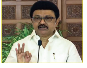
निर्धारण जनसंख्या के आधार पर होता है, तो तमिलनाडु की लोकसभा सीटें घट सकती हैं। इसलिए मैं अब नवविवाहितों से अपील करता हूँ कि वे तुरंत बच्चे पैदा करें और उनका नाम अच्छे तमिल शब्दों पर रखें। मुख्यमंत्री एमके स्टालिन ने 1 मार्च को अपने 72वें जन्मदिन पर भी परिसीमन और भाषा नीति को लेकर बड़ा बयान दिया था। उन्होंने कहा था कि तमिलनाडु इस समय दो अहम लड़ाइयां लड़ रहा है। पहली लड़ाई भाषा की स्टालिन ने कहा कि हिंदी थोपने की कोशिश की जा रही है, जो तमिलनाडु के लिए अस्वीकार्य है। दूसरी लड़ाई परिसीमन की है। उन्होंने कहा कि अगर संसदीय सीटों का निर्धारण जनसंख्या के आधार पर होता है, तो तमिलनाडु की सीटें कम हो सकती हैं।

एजेंसी चेन्नई। तमिलनाडु के मुख्यमंत्री एमके स्टालिन ने परिसीमन योजना को लेकर केंद्र सरकार पर निशाना साधते हुए नवविवाहितों से एक अनोखी अपील की है। उन्होंने कहा कि वे जल्द से जल्द बच्चे पैदा करें और उन्हें अच्छे तमिल नाम दें। स्टालिन का यह बयान उस वक आया है जब तमिलनाडु में परिसीमन और तीन-भाषा नीति को लेकर राजनीति गरमा गई है। तमिलनाडु के नगरपट्टिनम में डीएमके जिला सचिव के विवाह समारोह में सीएम स्टालिन ने कहा, मैं पहले नवविवाहितों से कहता था कि वे अपनी सुविधा के अनुसार परिवार बढ़ाएं, लेकिन अब परिस्थितियां बदल गई हैं। केंद्र सरकार परिसीमन जैसी नीतियां लागू करने की योजना बना रही है, जो तमिलनाडु के लिए मुकसानदायक हो सकती हैं। हमने परिवार नियोजन को सफलतापूर्वक लागू किया, लेकिन अब हमें इसके दुष्परिणामों का सामना करना पड़ सकता है। उन्होंने आगे कहा, अगर संसदीय सीटों का निर्धारण जनसंख्या के आधार पर होता है, तो तमिलनाडु की सीटें कम हो सकती हैं।