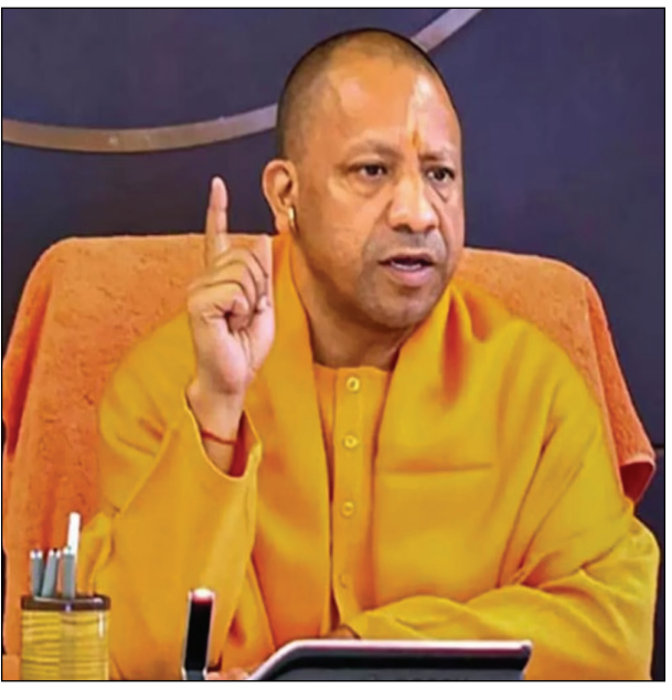
उत्तर प्रदेश के मुख्यमंत्री ने कहा कि उत्तर प्रदेश में सबसे गंभीर प्रदूषण बिंदु कानपुर था, जहां 125 वर्षों तक, जाजमऊ में प्रतिदिन चार करोड़ लीटर अनुपचारित सीवेज गंगा में प्रवाहित होता था। हमने इसे तीन साल पहले बंद कर दिया था और आज, सीवेज की एक भी बूंद नदी में नहीं गिरती है। आदित्यनाथ ने यह भी कहा कि कानपुर के टेनरी अपशिष्टों को, जो कभी अत्यधिक जहरीला था और गंगा में जलीय जीवों को खत्म करने के लिए जिम्मेदार था, सख्त नियंत्रण में लाया गया है। उन्होंने कहा कि हमने दो साल पहले चौबीसों घंटे सीसीटीवी निगरानी स्थापित की थी और सभी टेनरियों के लिए उपचार संयंत्र अनिवार्य कर दिए थे। जो इसका पालन करने में विफल रहे, उन्हें बंद करना पड़ा।