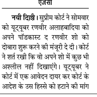
कोर्ट ने शो को प्रसारित करने से रोक दिया गया था। दरअसल, समय रैना के शो ईंडियाज गॉट लेटेंट में माता-पिता पर अभद्र टिप्पणी के विवाद के बाद देश के कई शहरों में उन पर एफआईआर हुई थीं। इसके बाद अलाहबादिया के पांडकास्ट द रणवीर शो में सेलिब्रिटीज ने आने से इनकार कर दिया था।

एजेंसी नयी दिल्ली। सुप्रीम कोर्ट ने सोमवार को यूट्यूबर रणवीर अलाहबादिया को अपने पांडकास्ट द रणवीर शो को दोबारा शुरू करने की मंजूरी दे दी। कोर्ट ने शर्त रखी कि वो अपने शो में कुछ भी अश्लील नहीं दिखाएंगे। यूट्यूबर ने कोर्ट में एक आवेदन दायर कर कोर्ट के आदेश के उस हिस्से को हटाने की मांग की थी, जिसमें शो को प्रसारित करने से रोक दिया गया था। दरअसल, समय रैना के शो ईंडियाज गॉट लेटेंट में माता-पिता पर अभद्र टिप्पणी के विवाद के बाद देश के कई शहरों में उन पर एफआईआर हुई थीं। इसके बाद अलाहबादिया के पांडकास्ट द रणवीर शो में सेलिब्रिटीज ने आने से इनकार कर दिया था।