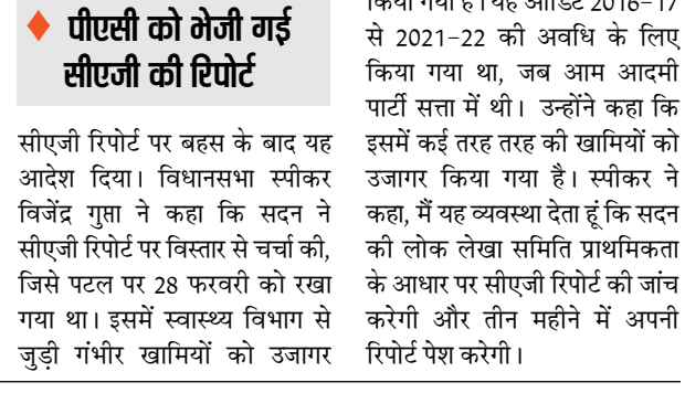
किया गया है। यह ऑडिट 2016-17 से 2021-22 की अवधि के लिए किया गया था, जब आम आदमी पार्टी सत्ता में थी। उन्होंने कहा कि इसमें कई तरह तरह की खामियों को उजागर किया गया है। स्पीकर ने कहा, मैं यह व्यवस्था देता हूँ कि सदन को लोक लेखा समिति प्राथमिकता के आधार पर सीएजी रिपोर्ट की जांच करेगी और तीन महीने में अपनी रिपोर्ट पेश करेगी।