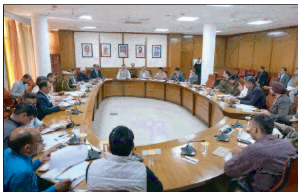
विश्व अध्यक्ष हरविंदर कल्याण ने सुरक्षा को लेकर हरियाणा, पंजाब और यूपी चंडीगढ़ के शीर्ष अधिकारियों के साथ की बैठक

चंडीगढ़, 4 मार्च हरियाणा विधान सभा के 7 मार्च से शुरू हो रहे बजट सत्र के मद्देनजर विश्व अध्यक्ष हरविंदर कल्याण ने मंगलवार को सुरक्षा संबंधी बैठक बुलाई। इस बैठक में उन्होंने सत्र के दौरान सुरक्षा व्यवस्था चाक चौबंद करने के लिए हरियाणा, पंजाब और यूपी चंडीगढ़ के शीर्ष अधिकारियों से ब्योरे पर चर्चा की। कल्याण ने इन अधिकारियों को महत्वपूर्ण निर्देश भी दिए। बैठक में तय हुआ कि विधान सभा