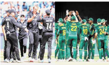
2020 विश्व कप (2021) में एक फाइनल में पहुंचने के बाद विगत जीतने से चूक गया था। दक्षिण अफ्रीका की टीम पिछले साल 2020 विश्व कप में सेमीफाइनल की बाधा पार करने में सफल रही थी, लेकिन उसे फाइनल में भारत ने हराया था। दक्षिण अफ्रीका और न्यूजीलैंड के बीच यह मुकामला लाहौर के गार्गरी स्टैडियम पर खेला जाएगा।

क्रासो, एजेंसी। चैंपियंस ट्रॉफी में अब तक शानदार प्रदर्शन करने वाली दक्षिण अफ्रीका टीम का सामना सेमीफाइनल में न्यूजीलैंड से होगा। यह दोनों ही टीमें लगातार अच्छा प्रदर्शन करती हैं, लेकिन बड़े मैचों में दबाव में आ जाती हैं। दक्षिण अफ्रीका और न्यूजीलैंड ने क्रमशः 1998 और 2000 में एक-एक बार चैंपियंस ट्रॉफी जीती है, लेकिन उस समय ईस्ट टैमरूम को अर्द्धसैमी नॉकआउट टूर्नामेंट का जीता था और उसका अर्थव्यवस्था नहीं थी। दक्षिण अफ्रीका जब बड़े टूर्नामेंट में चोखस (मुख्य मुकाम) में हार का सामना करने वाली टीम के अपने तमको को हटाना चाहोगा, वहीं न्यूजीलैंड की टीम भी विगत पर अपना कब्जा जमाने की दिशा में बढ़ती है। न्यूजीलैंड ने बड़े विश्व कप (2015 और 2019) में दो बार और