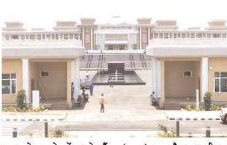
प्लान के दायरे में आते हैं, जबकि रूफटॉप पर केवल बैठने की व्यवस्था और हल्के अस्थायी ढांचे हैं। सुनना मानकों की बात करें तो अधिश्चमन विभाग से इन्हें नो ऑब्जेक्शन सर्टिफिकेट

रांची (एजेंसी): झारखंड हाई कोर्ट ने रूफटॉप बार और रेस्टोरेंट के दो संचालकों को बंदी राहत दी है। कोर्ट ने प्रेक्षा किन्वन एंव बार और प्राणा लाउज आरएस स्क्वेयर की याचिकाओं पर सुनवाई करते हुए, इनके संचालन को बंद करने के रांची नगर निगम के आदेश पर रोक लगा दी है। याचिकाकर्ताओं की ओर से अतिरिक्त अग्रार्थ बतने ने कोर्ट में दलील दी कि वे दोनों बार एवं रेस्टोरेंट जिस इमारत में स्थित हैं, उसका नक्शा रांची नगर निगम द्वारा स्वीकृत है। उन्होंने यह भी बताया कि इनका किचन और स्टोर रूम स्वीकृत