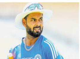
भारतीय क्रिकेट कंट्रोल बोर्ड (बीसीसीआई) के विशेषज्ञों की निगरानी में उनका इलाज चला। उनके दुर्घटे के तीन निगरानीयों की चरखी की गई थी। पंत ने गंगारू में राणवीर क्रिकेट अकादमी में रिहैब किया था।

नई दिल्ली, एजेंसी। भारतीय टीम के स्टार विकेटकीपर बल्लेबाज ऋषभ पंत को बड़ा सम्मान दिया जा सकता है। पंत दिसंबर 2022 में भारत दुर्दटना में गंभीर रूप से घायल होने के बाद क्रिकेट के मैदान पर वापसी करने में सफल रहे थे।