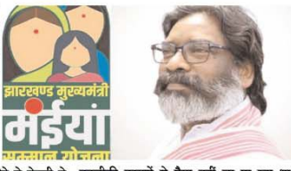
तकनीकी कारणों से पैसा नहीं जा पा रहा था। मंत्री ने सदन में भरसा दिलाया था कि एक साथ मईयां सम्मान योजना की राशि होली से पहले लाभुकों के खाते में भेजी जाएगी। बता दें कि झारखंड की हेमंत सोरेन सरकार ने आधी आबादी को बड़ी सौगात दी है। महिलाओं के लिए सरकार ने खजाना खोल दिया है। मुख्यमंत्री मईयां सम्मान योजना के लिए बजट में 13 हजार 363 करोड़ रुपये का प्रावधान किया गया है।

रांची (एजेंसी): होली से पहले झारखंड सरकार राज्य की महिलाओं को बड़ी बुशखबरी दे सकती है। दरमजल ऐसी खबर आ रही है कि अंतरराष्ट्रीय महिला दिवस यानि ८ मार्च से मईयां सम्मान योजना की राशि ट्रांसफर कर दी जाएगी। जनवरी, फरवरी और मार्च तिनों महीने का पैसा एक साथ महिलाओं के खाते में जाएगा। दरमजल महिलाएं दो महीने से बेसव्री से इंतजार कर रही हैं कि सरकार कब तक उनके बैंक खाते में पैसा भेजेगी, हालांकि यह इंतजार अब खत्म होने वाला है। ८ मार्च से महिलाओं के खाते में पैसे भेजे दिए जाएंगे। वित्त मंत्री राधाकृष्ण किशोर ने स्पष्ट किया है कि जनकल्याण की योजनाओं को संचालित करने के लिए धन की कोई कमी नहीं है। मईयां सम्मान योजना की राशि के संबंध में उन्होंने कहा कि कुछ