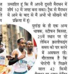
उत्साहित हूँ कि मैं अपनी दूसरी मेरथान में शीर्ष 10 में जाहूद बना सका। ट्रेक से मेरथान में आने के बाद से मैं अभी भी सोखने की प्रक्रिया में हूँ। युवाओं के ही एक अन्य धाक, स्टैपन किस्सा, 25वें स्थान पर रहे लेकिन क्वालीफायर समय को पार करने में असफल रहे। गौरतलब है कि चेट्टेगी ने पिछले साल 42 की मेरथान पर ध्यान केंद्रित करने के लिए 5,000 मीटर और 10,000 मीटर की दौड़ से हटने की घोषणा की थी। उन्हीने 2023 में कालेडिया मेरथान में अपना उन्धे किया था, जहाँ वे 37वें स्थान पर रहे थे।

नई दिल्ली, एजेंसी। युवाओं के दिग्गज धाक जोशुआ चेट्टेगी ने जपान के टोक्यो में आयोजित मेरथान में शानदार प्रदर्शन करके 2025 विश्व एथलेटिक्स चैंपियनशिप के लिए क्वालीफाई कर लिया है। दो बार के ओलंपिक स्वर्ण पदक विजेता चेट्टेगी ने रविवार को टोक्यो मेरथान में 2 घंटे 5 मिनिट 59 सेकंड का समय निकालते हुए नया स्थान हासिल किया। और विश्व एथलेटिक्स चैंपियनशिप के लिए निर्धारित 2:06:30 के इलाकीय समय को पार कर लिया। इस रन में इंडीयोनिया के टाइड तकले ने पहला स्थान प्राप्त किया। चेट्टेगी ने क्वालीफाई करने पर खुशी जताते हुए कहा, मैं बहुत