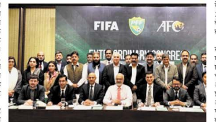
निर्णय समर्थन के लिए आभार व्यक्त करता है और पाकिस्तान फुटबॉल महासंघ को बधाई देता है। तीसरे बार लगा यह प्रतिबंध फीफा ने 2017 और 2021 में तीसरे पक्ष के अत्यधिक के कारण पाकिस्तान पर दो बार प्रतिबंध लगाया था। 2019 में, संघटन ने पीएफएफ के संघटन और चुनौतियों निगरानी के लिए एक सामाजिककरण समिति गठित की थी। हाल ही में, 7 फरवरी 2025 को फीफा ने नियुक्त चुनवा सुधारित करने वाले सर्वेक्षण को न मानने के कारण पाकिस्तान पर तीसरे बार प्रतिबंध लगाया था। लेकिन अब फीफा द्वारा अनुमोदित सर्वेक्षण में बदलाव के बाद पीएफएफ को अंतरराष्ट्रीय फुटबॉल में हिस्सा लेने की अनुमति मिल गई है। अंतरराष्ट्रीय मंच

नई दिल्ली, एजेंसी। फुटबॉल की विश्व नियामक संस्था फीफा ने पाकिस्तान फुटबॉल महासंघ (पीएफएफ) पर लगे प्रतिबंध को हटा दिया है। यह फैसला पीएफएफ असाधारण कॉररिड द्वारा सुझाए गए सर्वेक्षण रिपोर्टों को मंजूरी मिलने के बाद लिया गया। पीएफएफ ने एक आधिकारिक बयान में कहा, 27 फरवरी को पीएफएफ असाधारण कॉररिड के सफल तरीके के बाद फीफा ने पाकिस्तान फुटबॉल महासंघ पर से प्रतिबंध हटा दिया है और उसके पूर्ण सदस्यता अधिकार बहाल कर दिए हैं। संस्था ने ओग कहा कि वह फीफा और एशियाई फुटबॉल परिषद (एएफसी) के