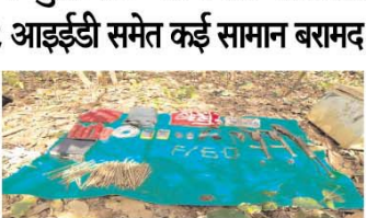
डेटोनेटर (29 डुअल डेटोनेटर ट्यूब) और 4 बंडल कईस से बायर बरामद किए गए। बम निरोधक दस्ते ने सुरक्षा कार्यों से सभी विकोटोडों को मौके पर ही हटा कर दिया। कैप से एक देशी पिस्तौल, 2 देशी कानबाई और एक देशी बोट एक्शन राइफल जन्त की गई। इसके अलावा 302 बोर के 13 राउंड, ७.62 एएमएम के कई राउंड और एक पिस्टल रांड भी बरामद हुए।

रांची (एजेंसी): पश्चिमी सिंहभूम जिले में सुरक्षाबलों को बड़ी सफलता मिली है। जिला पुलिस और सीआरपीएफ की 50वीं बटालियन ने संयुक्त अभियान चलाकर टोटो थाना क्षेत्र के हसिणी बन्नाग्राम के पास एक नक्सली कैप ध्वस्त कर दिया। नक्सली कैप से 2 आइडिडी (प्रत्येक 10 किलो), 4