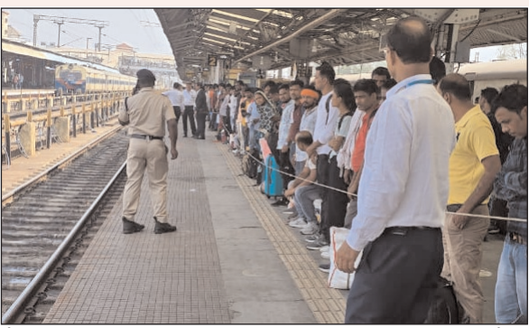
बोर्डिंग के लिए रेलवे प्रशासन ने पहले सुचारु प्रबंधन के लिए आसनसोल जंक्शन के बाहर एक कवर्ड वेंचिंग खाना होने वाली थी। इस ट्रेन में सुगम

संताल एक्सप्रेस संवाददाता देवघर। होली के त्योहार को देखते हुए पूर्व रेलवे के आसनसोल मंडल ने स्पेशल ट्रेनों के सुचारु संचालन के लिए व्यापक भीड़ प्रबंधन उपाय लागू किए हैं। साथ ही रेलवे सुरक्षा बल और राजकीय रेलवे पुलिस के जवानों को नौतन किया गया है, ताकि यात्री भीड़ को नियंत्रित किया जा सके। कतराओं को व्यवस्थित रखने और भीड़भाड़ से बचाने के लिए सुरक्षा कर्मी चौकसी बरत रहे हैं। साथ ही बड़े यात्री दबाव को देखते हुए आसनसोल, दुर्गापुर, चित्तंरजन, मधुपुर और जसीडीह