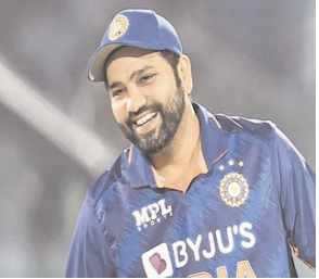
कोतक 98वें आर ऑलराउंडर थार रे 8गोटेच जायगा रकपा कतेक 8वें जायगा रेय सेटेर एना। चैंपियंस ट्रॉफी रे दक्षिण अफ्रीका रेन

बल्लेबाज रसी वैन डेर डुसेन दो सेमीफइनल रे 69 रन पारी रेय गालेयेना, ओना ते उनी दो मित जायगा रेयाक पोरोहोय जाम केदा आर नित उनी दो 13 वें जायगा रेयसेटेर एना। ओन्डे, न्यूजीलैंड रेन ग्लेन फिलिप्स दो 6 गोटेच जायगा रकपा कतेक 24 वें जायगा रेय सेटेर एना, बिचकोम उनी रेन सोंगे खिलोडी खेविड मिलर दो मोड़याक जायगा रेयाक पोरोहोय जाम केदा आर नित उनी दो 26 वें जायगा रे रेमेनाया। न्यूजीलैंड रेन ही केन बिलियमसन दो बारया जायगा रकपा