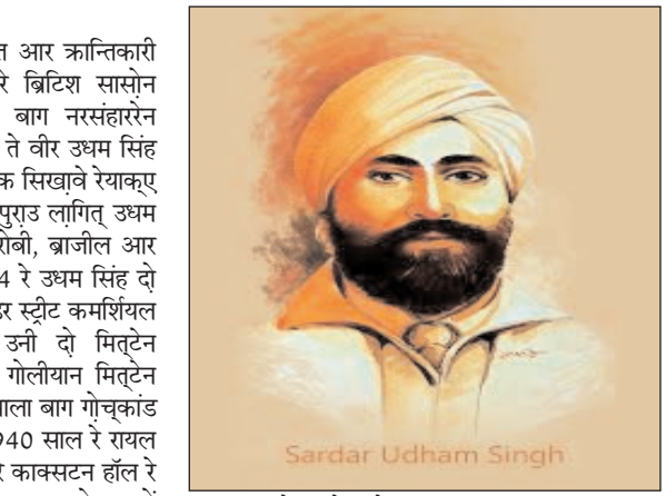
दियाल तायोम खोन मोर्चा सामबइव तुलुच उधम सिंह दो माइकल ओडयार चेतान रे गोलीय चालाव केदा। बार गोली ते माइकल ओडयार दोयजोस एना, नोआ ते तुराते गोच एना। उधम सिंह दो ओण्डे खोनदुइजोइ बाय कुरुमुटू लेदा आर बोरोडे साप ओचोयेना। उनी रेकेस चालाव एना। 4 जून 1940 हिलोक् उधम सिंह दो गोचकांड रेन दुसीको मानाव केदेया आर 31 जुलाई 1940 हिलोक् दो उनीको पासीकेदेया।