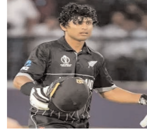
केदा, चेदाकजे उनी दो ट्रूमिंट रे 263 रन बेनाव छड पेय विकेट होंय हाताव केदा। रचिन एण्डरे रे उनी दो गेंदबाजी रे 22 गोटेच जायगा रकपा

बेनाव कोतक भारत दो 252 रन रेयाक लक्ष्य हासिल लागित ते गोड़येचि रोहित दो बार जायगा रकपा कतेक तेसाक जयगा रेय सेटेर एना। दोसरा सेच, रचिन खवींद्र दो चैंपियंस ट्रॉफी रे आडी मोजे गालेयेना। सेमीफइनलरे दक्षिण अफ्रीका बिरुद रे 108 रन आर फइनल रे भारत बिरुद रे 37 रन बेनाव कतेक खवींद्र दो 14 गोटेच जायगा रकपा कतेक करियर रेयाक जोतो खोन मोज 14 धावक रैंकिंग रेय सेटेरएना। रचिन दो प्लेयर ऑफद ट्रूमिंट रेयाक सिरफ होंय जाम