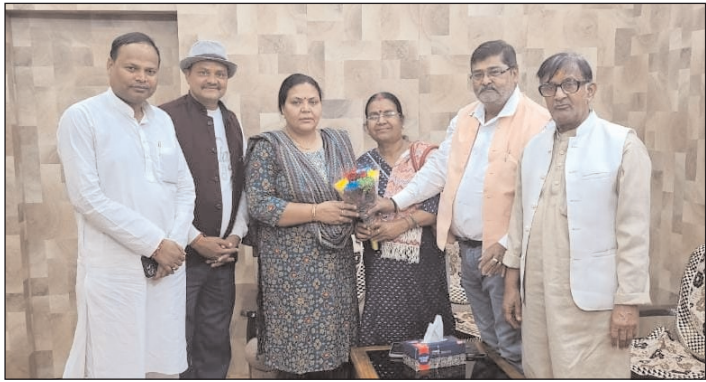
संताल एक्सप्रेस संवाददाता देवघर। रांची से गोड्डा जाने के क्रम में देवघर परिसर में आई झारखंड सरकार की मंत्री सह संताल परगना