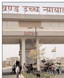
वृण्ड उच्च न्यायालय