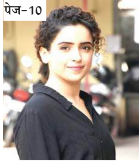
मिसेज के बाद साइंस बेस्ट मूवी....