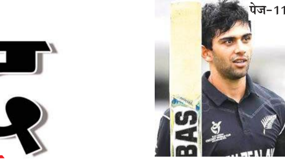
रचिन रविन्द्र टूनामेंट में सबसे ज्यादा ...

माहौल है। वारदात के बाद से पूरे परिसर के साथ-साथ कोल साइडिंग में सननाटा पसर है। साथ ही बानादाग