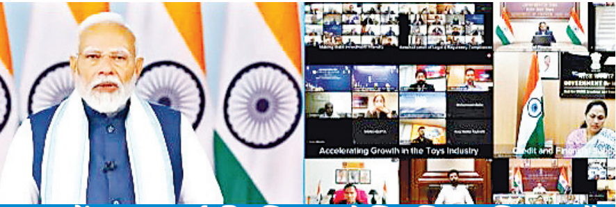
बजट में एमएसएमई की परिभाषा को फिर विस्तार दिया गया है

नई दिल्ली। प्रधानमंत्री नरेन्द्र मोदी ने भारत को वैश्विक अर्थव्यवस्था के लिए विकास इंजन बताते हुए मंगलवार को कहा कि आज दुनिया का हर देश भारत के साथ अपनी आर्थिक साझेदारी को मजबूत करना चाहता है। उन्होंने कहा कि हमारे विनिर्माण क्षेत्र को इन साझेदारियों का लाभ उठाने के लिए अधिक से अधिक पहल करनी चाहिए। प्रधानमंत्री वीडियो कॉन्फ्रेंसिंग के माध्यम से सूक्ष्म, लघु और मध्यम उद्यम (एमएसएमई) क्षेत्र पर बजट के बाद वैश्विक को संबोधित करते कर रहे थे। उन्होंने कहा कि विनिर्माण और निर्यात पर ये बजट वैश्विक हर दृष्टि से बहुत महत्वपूर्ण है। ये बजट हमारी सरकार के तीसरे कार्यकाल का पहला पूर्ण बजट था। इस बजट की सबसे खास बात रही, अपेक्षाओं से अधिक डिलीवरी। कई क्षेत्र ऐसे हैं जहां विशेषज्ञों ने भी जितनी अपेक्षाएं की थीं, सरकार ने उससे अधिक कदम उठाए हैं। उन्होंने कहा कि किसी भी देश में विकास के लिए स्थिर नीति और अच्छा कारोबारी माहौल बहुत जरूरी है। कुछ साल