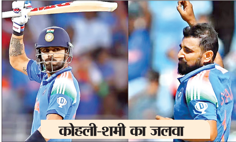
कोहली-शमी का जलवा

आईसीसी चैपियंस ट्रॉफी 2025 का पहला सेमीफाइनल मैच भारतीय टीम और ऑस्ट्रेलिया के बीच मंगलवार को दुबई इंटरनेशनल स्टेडियम में खेला गया। मैच में टॉस ऑस्ट्रेलिया के कप्तान स्टीव स्मिथ ने जीता और पहले बल्लेबाजी करते हुए 265 रनों का टारगेट दिया। जवाब में भारतीय टीम ने 4 विकेट से मुकाबला जीतकर फाइनल में एंट्री कर ली। रोहित शर्मा की कप्तानी में भारतीय टीम का अजेय रथ जारी है। इसी के साथ टीम इंडिया ने ICC चैपियंस ट्रॉफी 2025 के फाइनल में एंट्री कर ली है। चैपियंस ट्रॉफी 2025 का पहला सेमीफाइनल मैच मंगलवार (4 मार्च) को भारत और ऑस्ट्रेलिया के बीच दुबई इंटरनेशनल स्टेडियम में खेला गया। इस मैच को टीम इंडिया ने 4 विकेट से जीत लिया। इस जीत के हीरो तेज गेंदबाज मोहम्मद शमी और विराट कोहली रहे। इस जीत के साथ रोहित ब्रिगेड ने चैपियंस ट्रॉफी 2025 के फाइनल एंट्री कर ली है। जहां उसकी टक्कर दूसरे सेमीफाइनल की विजेता टीम से होगी। दूसरा सेमीफाइनल न्यूजीलैंड और साउथ अफ्रीका के बीच 5 मार्च को लाहौर के गद्दाफी स्टेडियम में होना है। फाइनल मुकाबला 9 मार्च को दुबई में होगा।