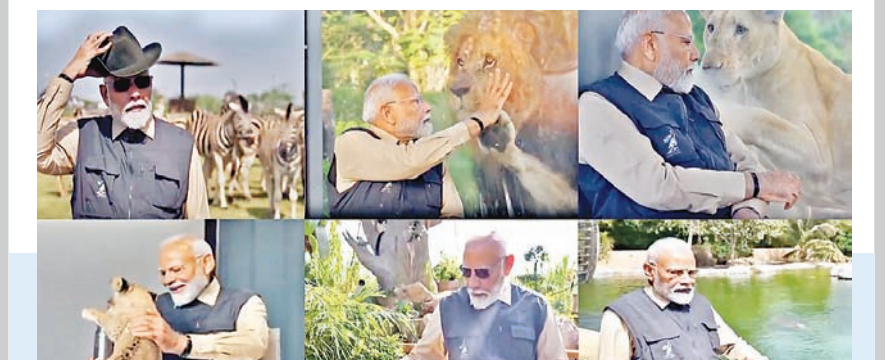
'वनतारा' में कैराकल को प्रजनन कार्यक्रम के तहत पाला जाता है

पीएम मोदी ने जिस सफेद शेर के शावक का दूध पिलाया था, उसका जन्म केंद्र में तब हुआ था, जब उसकी मां को रेस्क्यू कर 'वनतारा' लाया गया था। भारत में कभी बड़ी संख्या में पाए जाने वाले कैराकल अब दुर्लभ होते जा रहे हैं। 'वनतारा' में कैराकल को प्रजनन कार्यक्रम के तहत पाला जाता है और उनके संरक्षण के लिए केंद्र में रखा जाता है, फिर उन्हें जंगल में छोड़ दिया जाता है। पीएम मोदी ने अस्पताल के एमआरआई कक्ष का भी दौरा किया और एक एशियाई शेर के एमआरआई स्कैन को भी देखा। उन्होंने ऑपेरेटिंग थियेटर का भी दौरा किया, जहां एक तेंदुआ का इलाज किया जा रहा था, जो हाड़पि पर कार से टकराने के बाद जखमी हो गया था और रेस्क्यू कर लाया गया था। केंद्र में बचाए गए जानवरों को ऐसे स्थानों पर रखा जाता है।